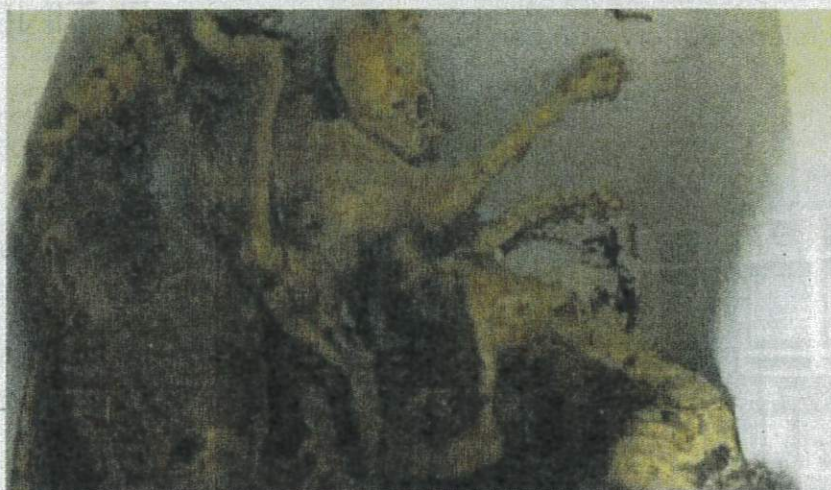
Puluhan bangkai dan rangka kucing di sebuah rumah sewa di Kondominium Bayu Tasik, Bandar Sri Permaisuri, Cheras.

Difahamkan, pemilik rumah terpenggil untuk membuat peme-