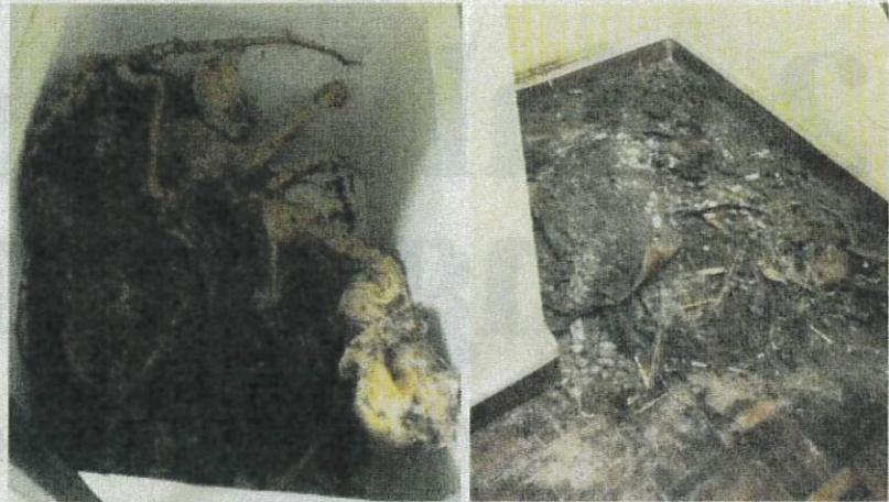
BANGKAI kucing yang ditemui di sebuah kondominium di Bandar Permaisuri, Cheras.

Terdahulu Harian Metro melaporkan penemuan pulu-