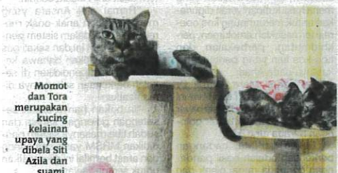
Momot dan Tora merupakan kucing kelainan upaya yang dibela Siti Azila dan suami.

"Dari segi perubatan setakat ini kami banyak habiskan untuk Tora. Kos bagi prosedur Cystostomy atau pembedahan bagi membuka saluran ke punca kencing sebelum ini menelan kos lebih RM6,000," katanya.