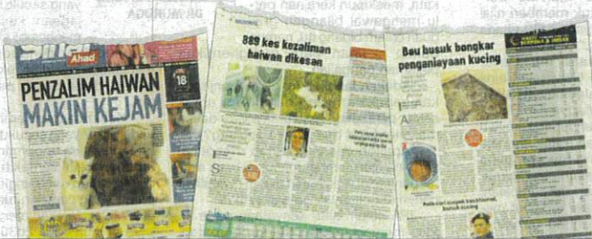
Laporan Sinar Harian pada Ahad.

Polis kemudian menerima laporan berhubung kejadian itu pada 13 Mac lepas dan membuka kertas siasatan mengikut Seksyen 428 Kanun Keseksaan kerana melakukan khianat dan membunuh haiwan.