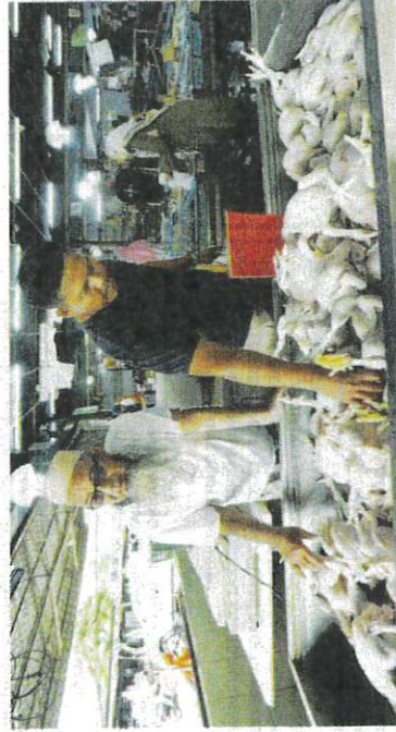
Tinjauan di sekitar pasar di Petaling Jaya semalam mendapati harga ayam segar masih terkawal dengan RM9.20 sekilogram.

Tinjauan di Mydin Subang Jaya Hypermarket mendapati, ayam standard dijual pada harga RM9.39 setiap kilogram (kg), manakala di sekitar Petaling Jaya antara RM9.30 hingga RM9.60 satu kg.