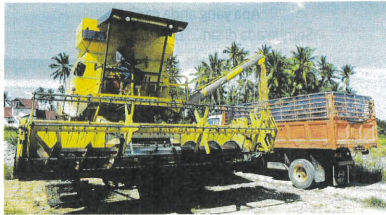
SEBUAH jentera menuai padi memindahkan hasil padi yang dituai ke dalam sebuah lori di Kampung Maras, Kuala Nerus, Terengganu.

nah sawah yang ingin saya jual di media sosial sejak sebulan dan beberapa individu bermimpi membeli tanah tersebut," katanya ketika dihubungi di sini semalam.