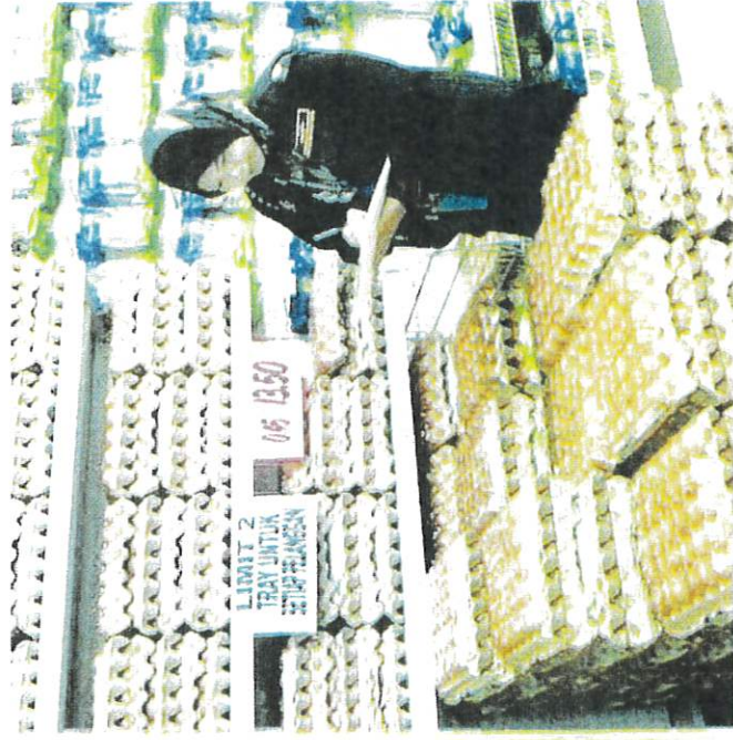
PEGAWAI penguat kuasa KDPN melakukan pemeriksaan bekalan telur ayam di premis perniagaan di sekitar Kuala Terengganu semalam.