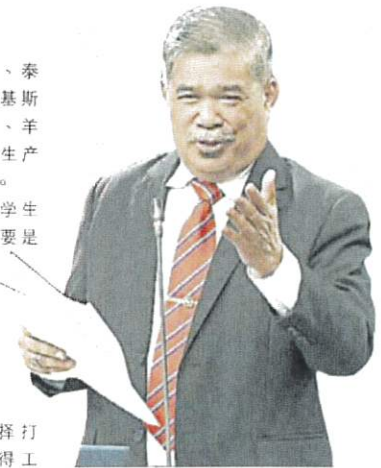
莫哈末沙布：引进的商品将视为国内生产的一部分