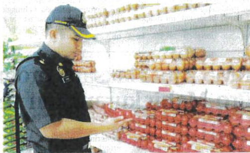
ANGGOTA penguat kuasa KPDN Terengganu memeriksa bekalan telur ayam yang dijual di sebuah premis di Kuala Terengganu, hari ini.

Selain itu, Saharuddin memberitahu, tiada penternakan ayam penelur di Terengganu dan bekalan telur ayam diterima daripada pengusaha ladang di