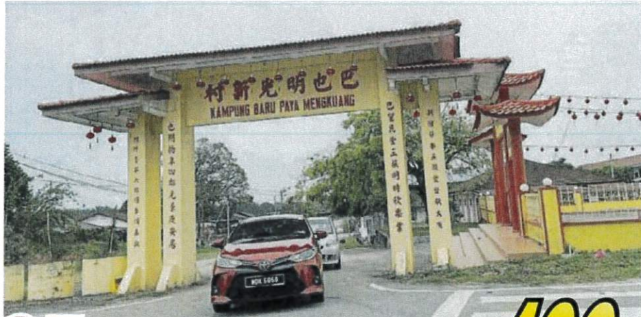
■巴也明光新村33所养猪场于2021年12月遭非洲猪瘟侵袭。