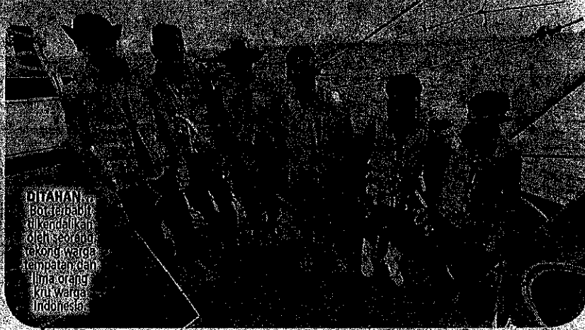
DITAHAN Bot nelayan dikendalikan oleh seorang rekord warga tempatan dan lima orang kru warga Indonesia.

"Komuniti maritim turut diminta untuk melaporkan segera sebarang aktiviti yang mencurigakan atau kemalangan di laut secara terus ke talian MERS 899 atau Pusat Operasi Maritim Zon Maritim Bintulu (086-314 254) / Pusat Operasi Maritim Negeri Sarawak (082-432544) yang beroperasi 24 jam," ujarnya.