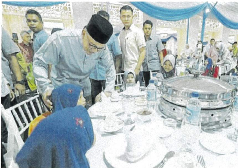
■安华在开斋聚餐会上与孤儿互动。