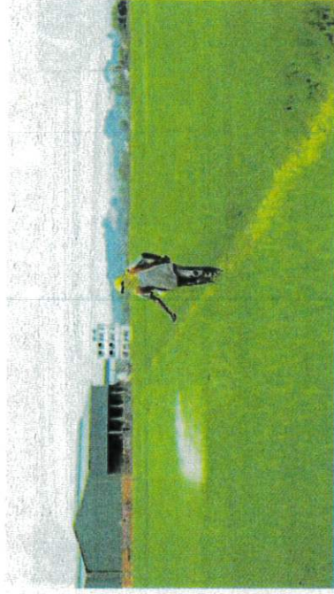
PENGELUARAN padi negara menyumbang sebanyak 30 peratus keperluan makanan negara. – GAMBAR HIASAN

Katanya, dalam mendepani cabaran termasuk kegawatan ekonomi global, antara usaha bagi memastikan keterjaminan bekalan makanan adalah memperluas pelaksanaan program Smart Sawah Berskala Besar.