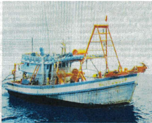
SALAH sebuah bot nelayan Vietnam yang ditahan ketika menangkap ikan di perairan negara dekat Kuala Terengganu, semalam.