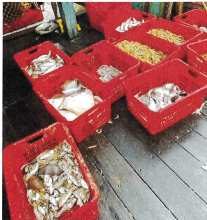
The confiscated catch was said to be worth RM2,310.

"The total value of the seized items was RM272,310.