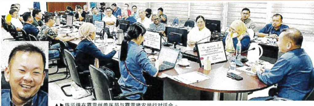
▲► 陈泓缜在霹靂州兽医局与霹靂猪农举行对话会。

(怡保 2 日讯) 农业及粮食安全部副部长陈泓缜强调，非洲猪瘟不应该是本地猪农与猪商就地起价的理由或借口。生猪价格几乎每个月涨价一次，根本是不合理且罔顾消费者经济负担的做法。