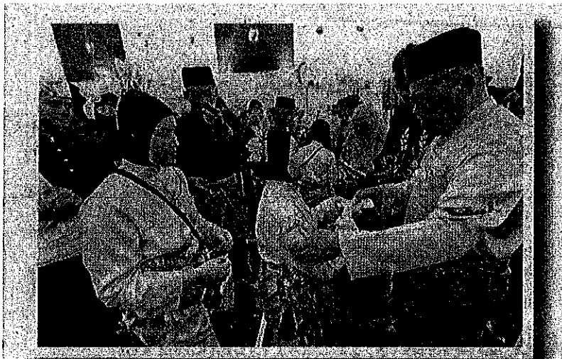
SUMBANGAN DUIT RAYA... Datuk Seri Mohamad Sabu menyampaikan sumbangan duit raya pada Majlis Rumah Terbuka Aidilfitri Parlimen Kota Raja di Dewan MBSA Kota Kemuning Utama, semalam.