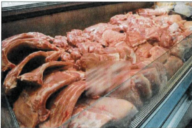
政府从今年4月份开始已陆续向受到非洲猪瘟影响的猪农发放补贴金，总额约达1100万令吉。

「我希望禽畜业的同仁们，你们要了解市场的情绪，不是说想起就起，当到了一个临界点的时候，其实人们有很多选择。」