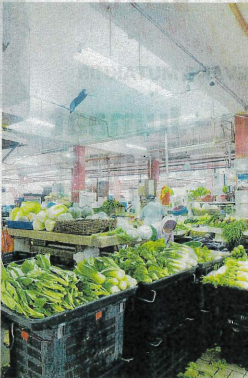
PENIAGA menjual sayur-sayuran di Pasar Basah Jalan Othman, Kuala Lumpur semalam.

"Kalau tak naikkan harga, saya tidak untung," katanya.