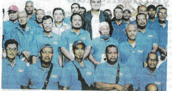
SERAMAI 180 nelayan daripada golongan B40 dijangka beralih kepada projek rintis Kebun Kerang di Serkam, Melaka.