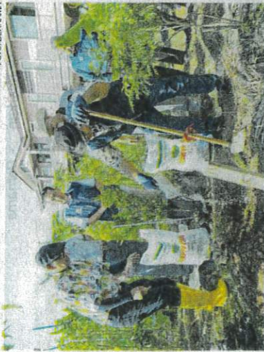
Aaron (kanan) menabur baja ketika menanam pokok mempelam sempena lawatan beliau ke Tapak Projek Kebuniti Madani KRT Taman Mutiara dan Taman Koperasi di Alor Setar pada Selasa.

ALOR SETAR - Hampir 50 peratus daripada keseluruhan 113 Kebun Komuniti (Kebuniti) di seluruh negara telah memasuki fasa pengkomersialan dengan ada antaranya berjaya meraih pendapatan sehingga mencecah puluhan ribu ringgit setahun.