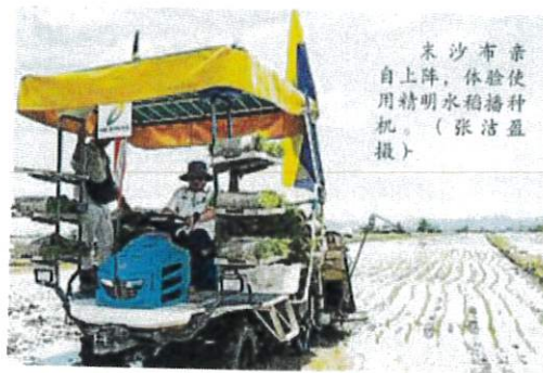
末沙布親自上陣，體驗使用精明水稻播種機。

(加央9日訊) 农业及粮食安全部长莫哈末沙布说，政府已做好粮食安全的应急策略，鉴定粮食供应商及供应国，一旦某地区面对粮食短缺，将会把所需粮食抵抵应付需求，而各国政府也采取相应措施，在粮食供应互相照应。