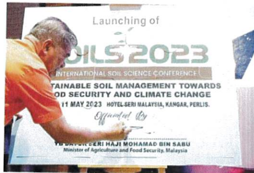
莫哈末沙布为“2023年国际土壤科学大会”主持开幕仪式。