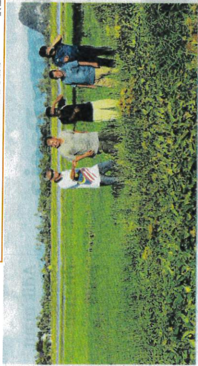
PESAWAH menunjukkan kawasan parit yang dipenuhi semak-samun sehingga menyebabkan air tersekat dan tidak dapat disalurkan keluar sekali gus menjadikan pesawah untuk memulakan kerja-kerja menanam padi di Kampung Pida Dua Sekerat, Guar Sanji, Arau. Perlis semalam.