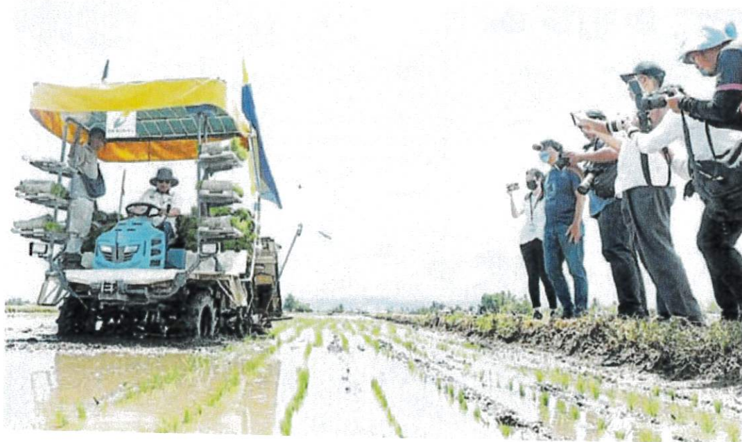
■ 末沙布在活动上驾驶机械学习种稻田。

“上述计划的推动对慕达农田区的稻米生产和农场管理质量产生影响，例如在计划实施期间每公顷田地产量高达10吨，生产力也将提高62.6%。”