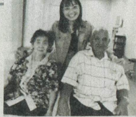
மரணமுற்ற தம்பதியுடன் அவர்களின் மகள்

சந்தைகளில் ஈக்கான் புந்தால் விற்பனை தொடர்பில் இன்னும் கண்காணிப்புகள் மேற்கொள்ளப்பட்டு வருகின்றன. விஷத்தன்மை கொண்ட மீன்களை விற்க வேண்டாம் என வியாபாரிகளுக்கு