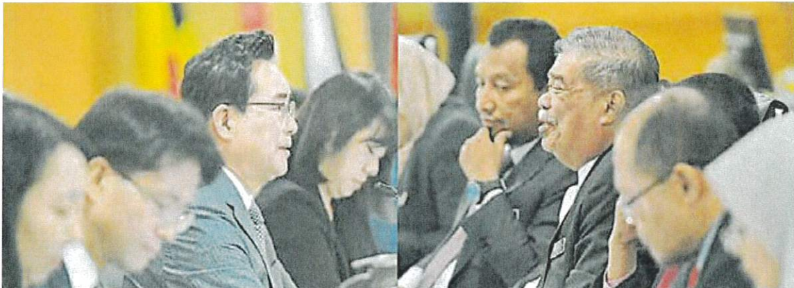
莫哈末沙布昨日在布城接见韩国农林畜产食品部长郑煌根。

“在2020至2022年期间，两国的农业贸易取得良好表现，每年增长10亿令吉。”