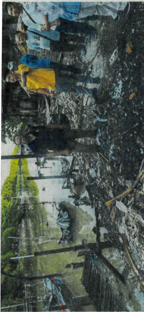
Muhammad Faiz menunjukkan bot dan jeti yang musnah dalam kebakaran di Jeti Kuala Sungai Burung.

Empat daripada bot itu hangus 100 peratus, manakala tiga lagi terbakar 50 peratus sehingga se-