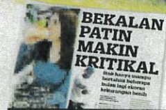
KERATAN Kosmo! 26 Mei 2023.

sangkar di daerah Jerantut dan Temerloh bukan sahaja semakin kritikal malah dijangka hanya mampu bertahan dalam tempoh beberapa bulan lagi ekoran kekurangan benih ikan.