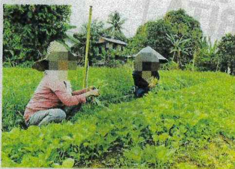
PENCEROBOHAN di atas tanah haram Pulau Meranti di Cyberjaya oleh warga asing dengan mengusahakan tanaman sayur-sayuran.

"Abang saya pinjam RM25,000 dari bank di Dhaka untuk berniaga di Malaysia. Dia perlu bayar pinjaman RM800 sebulan selama tiga tahun. Tapi bisnes dia gagal dan terpaksa tutup kedai runcit di Putrajaya. Mujur dia ada menyimpan wang dan menghulurkan saya modal berniaga," katanya.