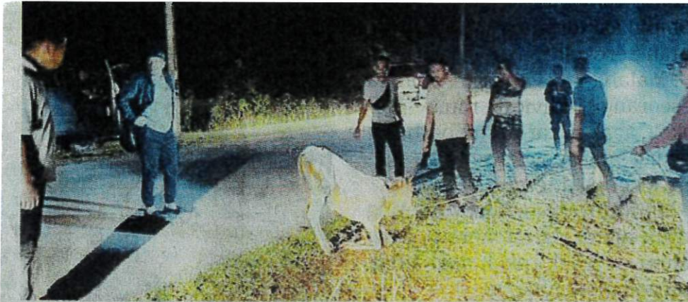
PASUKAN sukarelawan menangkap seekor lembu yang berkeliaran di Kampung Salong, Chini kelmarin.