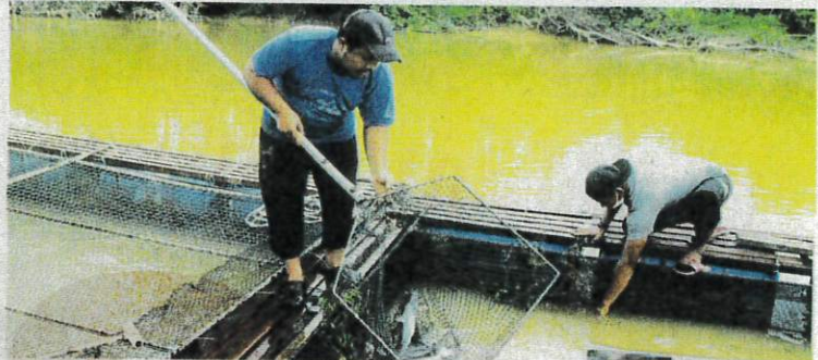
SEORANG penternak menangkap ikan patin di sangkarnya di Sungai Pahang, Temerloh.

"Kerajaan menyasarkan 480,000 tan metrik pengeluaran akuakultur seluruh negara bagi 2023 yang mana 125,557.22 tan metrik adalah pengeluaran ikan air tawar seperti tilapia, patin dan keli," katanya.