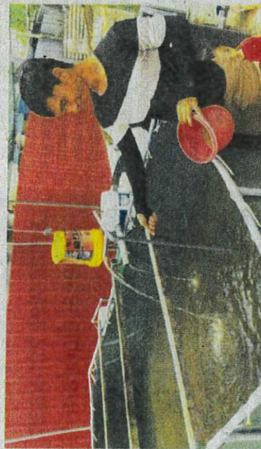
Anak-anak ikan diberi makan sebanyak dua kali setiap hari.

"Buat masa sekarang saya hanya menggunakan kereta untuk tujuan itu dan mahu mengumpul lebih ramai pelanggan baharu melalui promosi di media sosial seperti TikTok ," katanya.