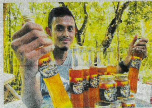
Madu kelulut dijual pada harga antara RM30 hingga RM180 sebotol mengikut saiz.