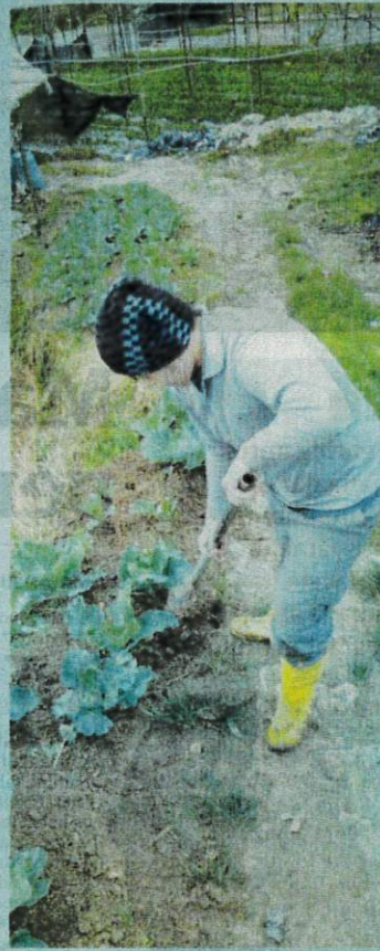
PEMBABITAN belia dalam sektor pertanian mampu memastikan kelestarian pengeluaran makanan negara.

"Saya meminati bidang pertanian selepas melihat kesungguhan ayah menyara keluarga