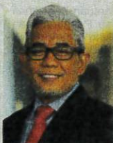
TENGGU AHMAD BADLI SHAH