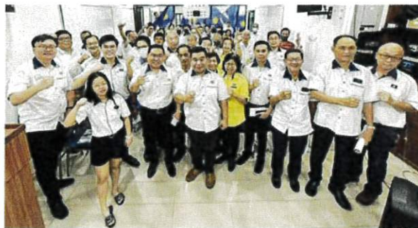
马华峇眼区会代表们誓言继续为民请命, 支持也监督团结政府运作。

“暂时性的填补洞口方式已经不管用, 居民们也开始烦躁, 因为影响日常生活, 同时也埋下危害道路使用者安全忧虑。”