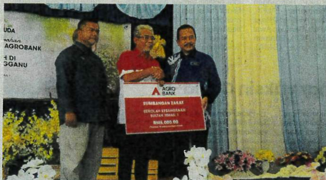
Tengku Ahmad Badli Shah menyampaikan zakat kepada 50 murid asnaf di Sekolah Kebangsaan Sultan Ismail 1.

"Dana ini untuk dijadikan modal menanam tanaman baharu dan boleh dipelbagaikan bagi menggalakkan murid melakukan aktiviti berfaedah," katanya.