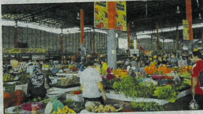
Pemodenan kaedah niaga meliputi aspek penyediaan premis, kemudahan yang lebih tersusun dan bersih menjadi keutamaan demi keselesaan kepada pengunjung.