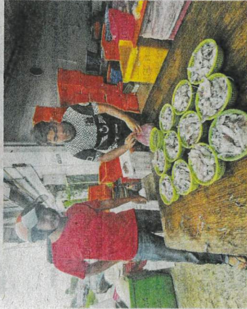
Antara sotong yang dijual pada harga rendah di Kampung Durian Burung, Kuala Terengganu.

KUALA TERENGGANU - Habitat yang masih terpelihara dan tidak diceroboh antara sebab peningkatan tangkapan sotong yang disifatkan sebagai luar biasa di daerah Kemaman dan Dungun.