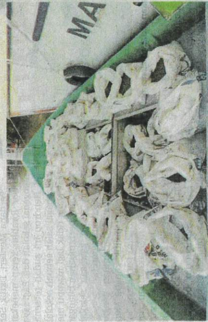
GUWI berisi benih kerang yang cuba diseludup ke Thailand menerusi peraliran Kuala Kedah-Kedah kelmarin.