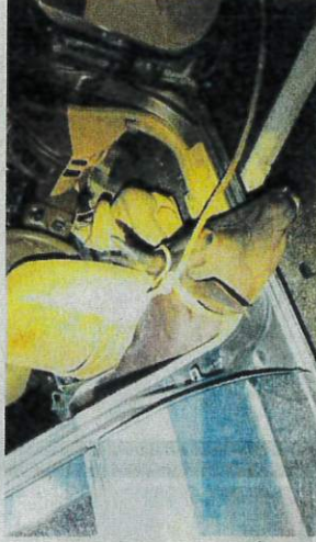
TINDAKAN penternak melepaskan haiwan peliharaan tanpa pemantauan membuka peluang pencuri.

Dia memberitahu, kejadian kecurian ini berlaku hampir di semua kawasan ladang yang mempunyai penternakan lembu seperti di Sertik, Mempaga, Lakur dan Lebu, dekat sini.