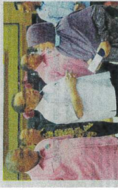
ABDUL FATTAH (tengah) menyantuni seorang ahli Koperasi Guru Melayu Selatan Berhad (Syguamas) selepas meraikan mesyuarat agong ke-70 koperasi itu di Temerloh, Pahang.

TEMERLOH: Hanya 172 daripada 16,315 koperasi di seluruh negara terlibat dengan aktiviti pengeluaran agromakanan walaupun sektor tersebut menduduki permintaan tinggi dalam kalangan rakyat negara ini. Menyentuh mengenai data statistik, Menteri Pertanian, Perikanan dan Ketahanan Makanan, Datuk Seri Dr. Abdul Fattah Abdulillah berkata, bagaimanapun jumlah itu terdapat kecil bagi membantu kerajaan meningkatkan kadar pengeluaran agromakanan. Tegasnya, gerakan koperasi perlu mempromosikan aktiviti pertanian seperti pengeluaran kepada satu produk demi meningkatkan peluang lebih tinggi. Menyerikan secara langsung, Abdul Fattah berkata, peningkatan pengeluaran agromakanan secara berkala adalah satu agromakanan berpotensi dieropa kerana sebahagian bahan yang diimport dari luar negara di Malaysia.