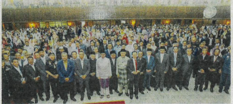
Perdana Menteri dan Menteri Besar Kelantan bersama penjawat negeri dan Persekutuan.

“Kadang-kadang kena ada insentif yang ditawarkan itu sangat baik, tetapi ada frasa yang disebut dengan kecepatan kelulusan bagi membolehkan pelabur datang,” katanya.