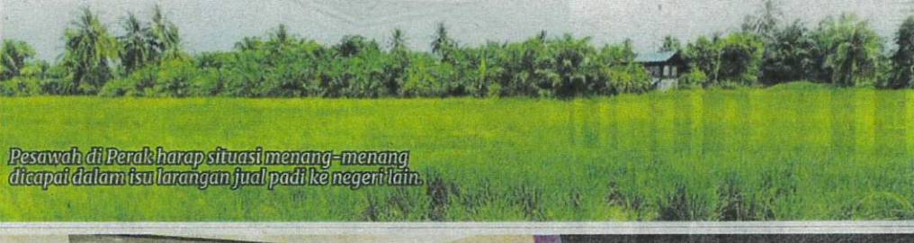
Pesawah di Perak harap situasi menang-menang dicapai dalam isu larangan jual padi ke negeri lain.