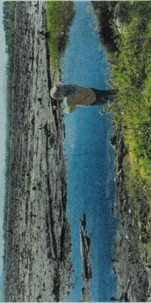
KOLAM Bukit Merah yang mula mengering akibat kemarau.