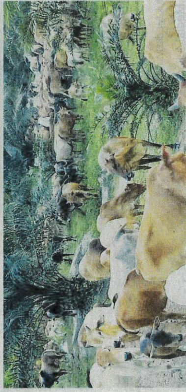
SEBAHAGIAN daripada haiwan ternakan di Sertik, Karak dekat Bentong yang menjadi sasaran pencuri lebih-lebih lagi menjelang musim perayaan.

Jelasnya, ia juga sukar bagi penternak untuk mengesan ternakan ketika dihambatkan kerana ada dalam kalangan mereka membela antara 20 hingga 100 ekor haiwan.