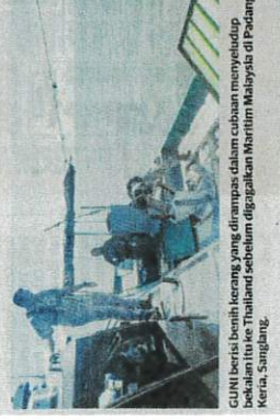
GUINI berkil benih kerang yang dirampas dalam cubaan menyeludup botikan itu ke Thailand sebelum digagalkan Maritim Malaysia di Padang Jerai, Sanglang.