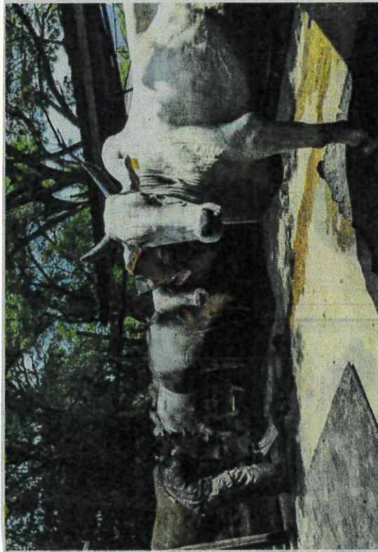
LEMBU ternakan 'gemuk' dan sihat menjadi pilihan pelanggannya bagi ibadat korban pada tahun ini.