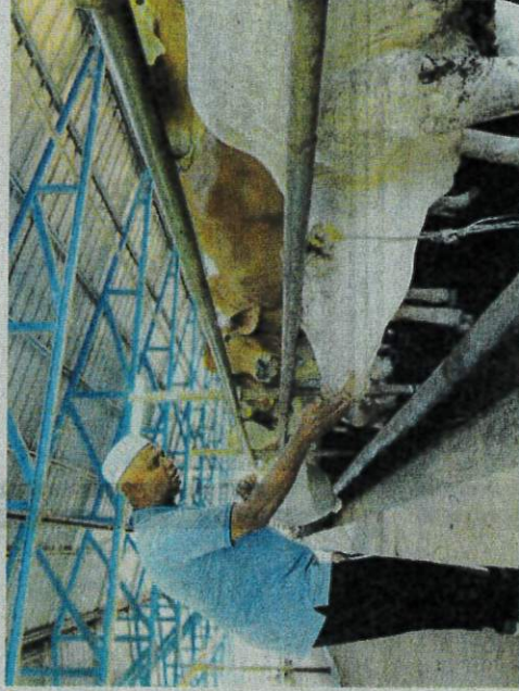
ZAINOL ABIDIN melihat lembu ternakan yang dipelihara untuk ibadah korban di Jalan Sintok, Jitra semalam.

bil daging sahaja, semua proses menyembelih dan melapah diruskan pihak ladang," katanya.