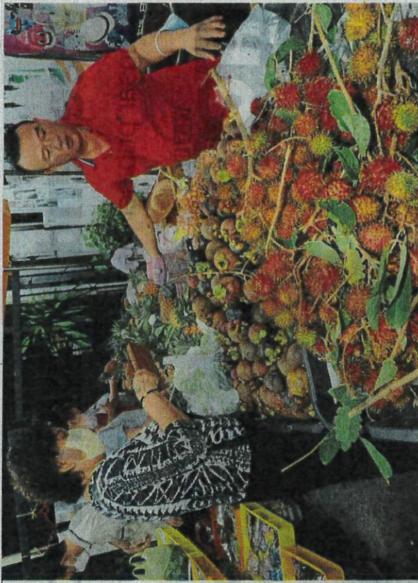
TS (right) selling a bountiful yield of rambutan and other tropical fruits at Jelutong market. (Below) Ah Kang sorting through mangosteens at his stall.

"I get my fruits from Penang and Kedah. This time, there seems to be ample supply."