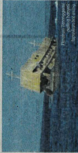
Perairan Terengganu paling banyak melupuskan bot asing.

"Semua bot yang dilupuskan adalah bot yang sudah dilucut hak oleh mahkamah menggunakan dua kaedah menenggelamkan un-