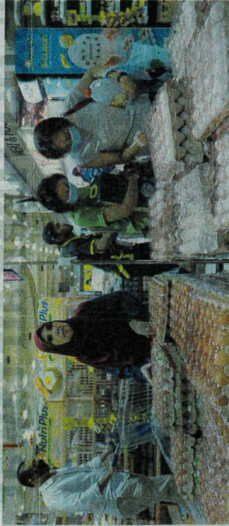
REAKSI sebahagian orang ramai semasa membeli telur ayam import dan tempatan yang dijual di Pasaraya Mydin Subang. Selangor, baru-baru ini.

"Berdasarkan libat urus dengan Kementerian dan agensi, pihak kami difahamkan bahawa data pengeluaran dan unjuran itu berdasarkan ketersediaan