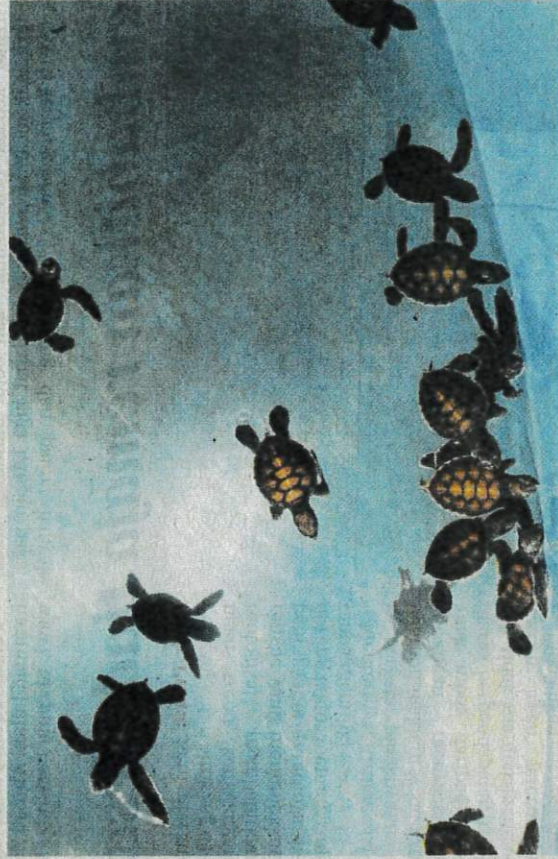
SEBANYAK 100 ekor penyu agar di lepaskan ke habitat asalnya.

jumlah pendaratan dicatat di tujuh negeri termasuk Negeri Sembilan dan Labuan. Beliau berkata, pada 1989, Perak membina Pusat Kon-