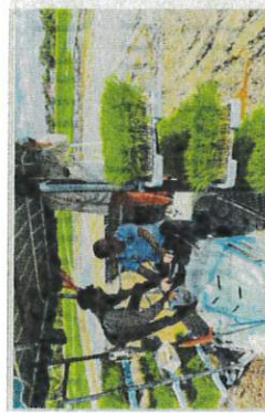
Aktiviti kebajikan bersama komuniti petani padi di kawasan program SMART SBE di Kampung Seri Baiter, Bukit Sembawang, (foto: NIK Izzadiah Nik Omar/PH)