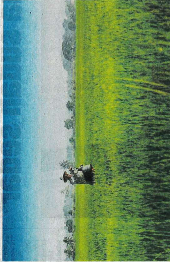
Inisiatif penanaman padi lima kali dalam dua tahun dijangka dapat meningkatkan pengeluaran padi sebanyak 25 peratus.

Tambahnya, sasaran Kedah untuk melaksanakan inisiatif penanaman padi lima kali dalam dua tahun dijangka dapat meningkatkan lagi pengeluaran padi sebanyak 25 peratus menjadi 1.25 juta tan