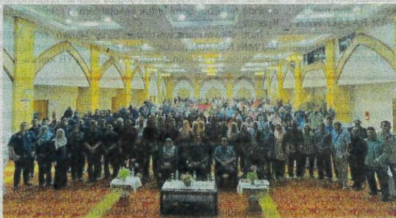
Sebahagian peserta dan jemputan yang hadir program Taklimat Kesan Penetapan Badan Awam Terhadap Pertubuhan Peladang anjuran bersama SPRM di Kompleks Kementerian Dalam Negeri, Meru Raya, Ipoh, pada Sabtu.

gram Taklimat Kesan Penetapan Badan Awam Terhadap Pertubuhan Peladang anjuran bersama SPRM di Dewan Bankuet, Kompleks Kementerian Dalam Negeri (KDN), Meru Raya di sini pada Sabtu.