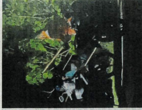
Sick act: A screenshot of the video.

She has called for higher allocations for the Veterinary Services Department or local authorities to set up dog pounds.