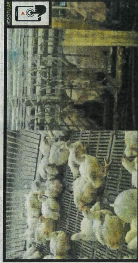
Tangkap layar video memaparkan ayam dan babi diternak di dalam kawasan yang sama dipercayai di sebuah ladang babi di Pulau Pinang.

Satu notis arahan turut dikeluarkan kepada pemilik ladang