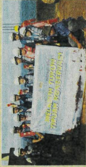
Misi melabuh tukun tiruan konservasi.