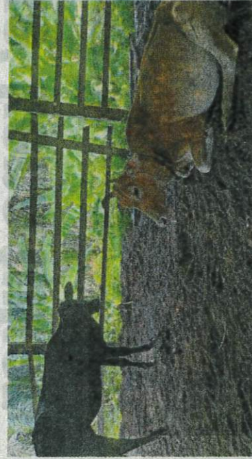
Keadaan lembu didakwa mengalami simptom kurang aktif, keluar lendiran cecair dari mulut dan hilang selera makan.

"Walaupun pergerakan dikawal dan pemakanan dijaga, masih ada yang mati setiap hari