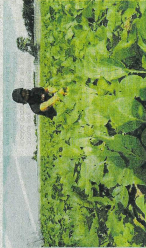
Program usahawantani sejajar matlamat Kertas Putih Pertahanan (KPP) untuk memartabatkan dan kemampanan sosioekonomi veteran ATM.

Adly berkata, program itu ditawarkan dalam dua kategori iaitu bakal pesara ATM dan veteran ATM di mana untuk bakal pesara, mereka perlu mengha-