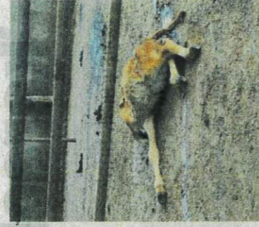
Keadaan bangkai anak lembu yang ditemukan pada Selasa.

kini lebih 40 ekor sudah mati," katanya.