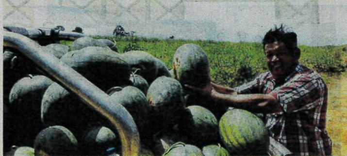
TEMBIKAI yang baharu dipetik akan dimuatkan dalam kenderaan pacuan empat roda untuk dihantar terus kepada pembedor.