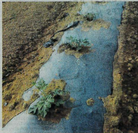
POKOK tembikai hidup subur di atas batas yang ditanam pada jarak satu kaki setiap pokok.

merah. "Pokok perlu disenyawakan untuk mengeluarkan buah. Kalau langkah ini tidak dilakukan, buah tidak dapat dihasilkan dan proses penanaman itu hanya sia-sia." "Pokok tembikai kuning ditanam untuk mendapatkan