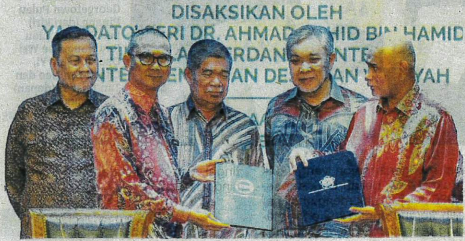
Ahmad Zahid (dua dari kanan) menyaksikan majlis pertukaran memorandum persefahaman antara Lembaga Kemajuan Johor Tenggara (Kejora) dengan Institut Penyelidikan dan Kemajuan Pertanian Malaysia (Mardi) bagi kerjasama strategik melalui program pembangunan pertanian dan pembangunan usahawan di Putrajaya pada Khamis.

"Kementerian, jabatan dan agensi-agensi kerajaan jangan lagi bertindak secara solo, mesti bergerak sebagai sebuah entiti besar dan tentunya rakyat akan melihat bagaimana usaha-usaha ini dilakukan," kata beliau.