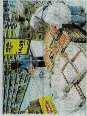
Nilai import makanan negara pada tahun lalu mencecah RM75.5 bilion. - GAMBAR HIASAN

"Jadi, Kementerian, jabatan dan agensi-agensi kerajaan pula, dinasihatkan tidak bertindak secara solo sebaliknya bergerak sebagai sebuah entiti besar dalam soal keterjaminan makanan negara," jelasnya.