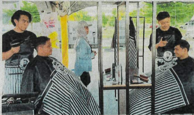
PELATIH Giat Mara Alor Setar turut menyediakan perkhidmatan gunting rambut Rahmah RM5 seorang sepanjang tiga hari karnival berlangsung.

zoo yang disediakan di sini. "Seronok jugak dapat tengok sendiri barangan keluaran usahawan sekali dapat membantu peniaga menjana pendapatan," katanya.