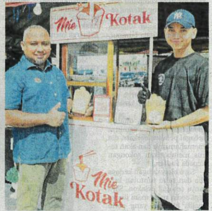
ZAFILIN (kiri) bersama usahawan KUD di Mini Karnival Usahawan Keda (KUD) @ Sungai Petani di Dataran Amanjaya.

Kesemua mereka adalah pelatih Kursus Senireka Gaya Rambut.