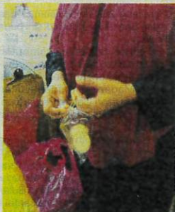
Bukti masih terdapat penjualan telur penyu di sebuah pasar basah dan kering di Kuala Terengganu.

KUALA TERENGGANU - "Jangan bising-bising, nak beli telur penyu kena diam-diam," kata seorang peniaga di sebuah pasar basah dan kering yang menjadi tumpuan ramai di sini.