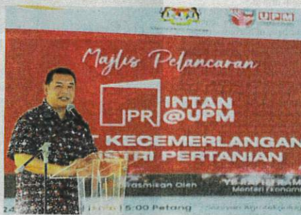
Rafizi said the Economy Ministry has been working on building a sustainable, modern agriculture sector in this country.

404.6ha of land bank all over the country, for modern farming facilities and is progressing to the next level of building the infrastructure.