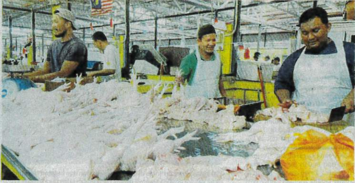
PENIAGA memotong ayam yang dipesan pelanggan di Pasar Awam Bachang, Melaka semalam.

"Dulu saya ambil bekalan 3,300 ekor ayam sehari, sekarang 4,000 sehari. Ada peniaga yang biasa ambil 700 ekor minta 900 ekor sebab harga murah," jelasnya.