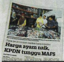
KERATAN Kosmo! 26 Mac 2023.

mintaan ayam menurun dan kita lihat ia adalah kesan daripada sambutan Aidiladha, umat Islam tidak membeli ayam, sebaliknya menghabiskan bekalan daging korban yang diagihkan.