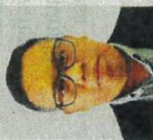
Pensyarah Kanan Sekolah Perniagaan dan Ekonomi, Universiti Putra Malaysia (UPM)

Oleh Dr Chakrin Uthir bhrencana@bh.com.my