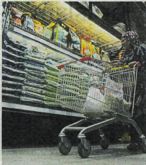
Orang ramai masih boleh mendapatkan beras tempatan pada harga RM2.60 sekilogram. (Foto hiasan)

Kenaikan hanya babit beras import tidak dikawal