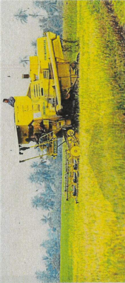
Inisiatif kerajaan memperkenalkan pengeluaran padi lima musim dalam tempoh dua tahun merangsang (Foto hiasan)