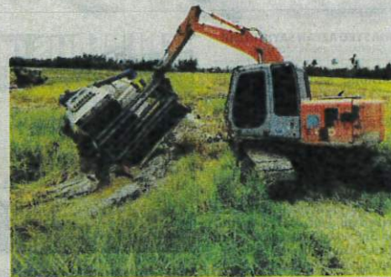
JENTUAI yang terbenam akibat tanah jerlus terpaksa ditarik keluar dari sawah menggunakan traktor ketika tinjauan di Tanjung Piandang, Parit Buntar.

Punca kejadian ini disebabkan keadaan cuaca yang tidak menentu pada musim ini hingga tiba musim menuai menyebabkan jentera mesin tuai tidak dapat menuai dalam petak sawah.