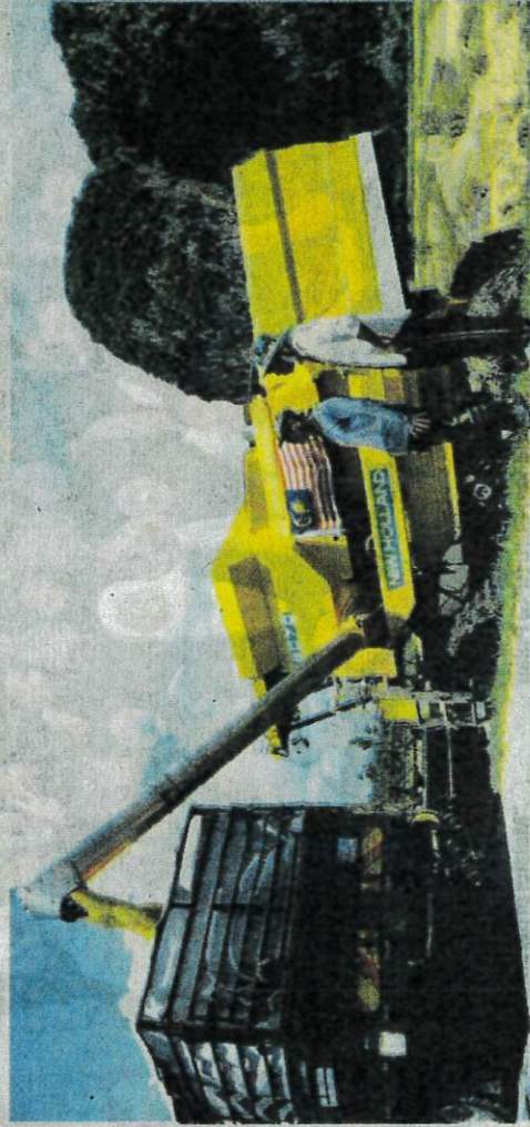
PESAWAH melihat hasil padi yang sudah boleh dituai di Kampung Bawah Bukit, Chuping, Perlis.

Ketika ini, hasil beras negara adalah sekitar 1.6 juta tan metrik setahun memabitkan keluasan tanaman 700,000 hektar di se-