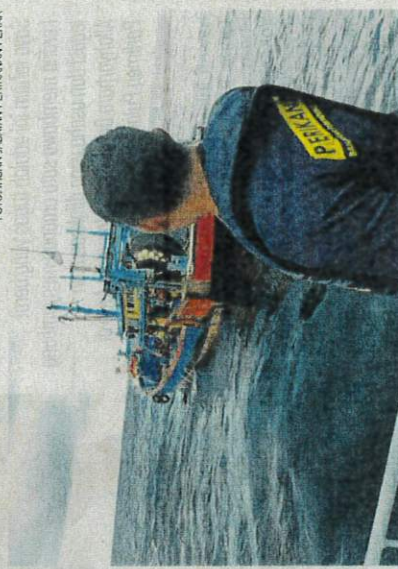
Pegawai Jabatan Perikanan yang menjalankan rondaan menahan sebuah bot pukat tunda di Kepulauan Sembilan, Pulau Pangkor pada Sabtu.

gunakan pukat tunda kurang dari lapan batu nautika, saiz mata kurang di bahagian keroncong kurang daripada 38 milimeter dan menggunakan alat radio komunikasi tanpa kebenaran.