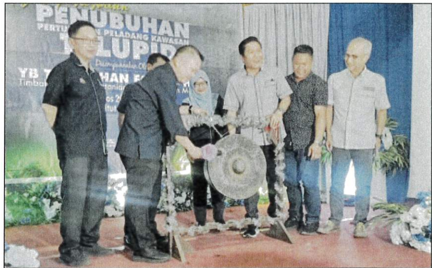
CHAN memalu gong sebagai simbolik perasmian penubuhan PPK Telupid.

Chan menambah, usaha kementerian adalah untuk memastikan tahap keterjaminan makanan negara terus terjamin namun usaha bersama diperlukan dari-