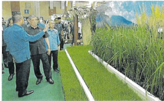
■莫哈末沙布说，稻米出口国印度和越南已发布预警，两国不久后将削减出口白米甚至是停止，大马作为印度、越南白米的进口国，届时恐将受影响。

(沙登25日讯) 农业及粮食安全部长拿督斯里莫哈末沙布表示，关于日本核废水排海导致海洋污染的课题，由于卫生部、环境专家及相关机构正在对进口自日本海产和食品进行研究，农业部目前尚未禁止日本的海产及食品进口大马。