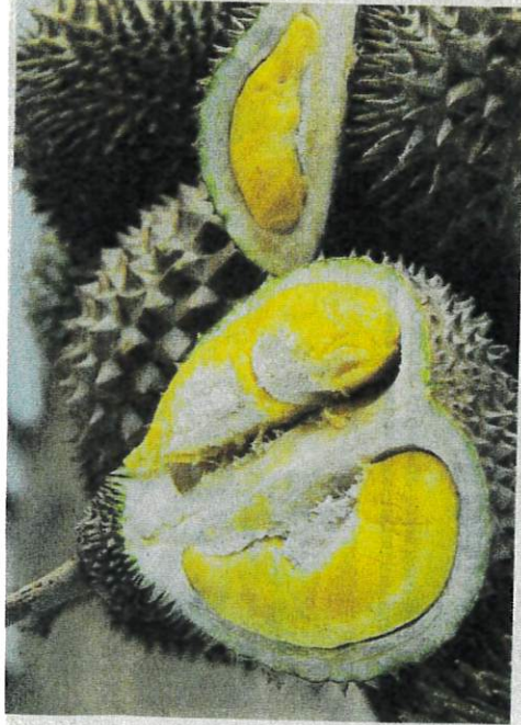
MUSANG KING antara durian yang bakal dijual murah pada program 'Makan Durian Sampai Jeluak' - CAMBAR HIASAN