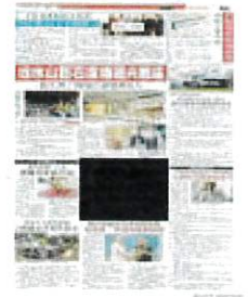
们合影。 末沙布与接获特别援助的小园主