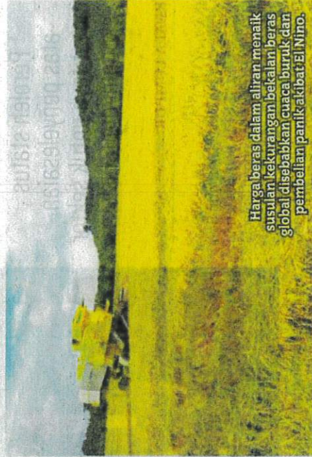
Harga beras dalam aliran menaik susulan kekurangan bekalan beras global disebabkan cuaca buruk dan pembelian panik akibat El Nino.

kurangan bekalan beras global berikutan keadaan cuaca buruk, pembelian panik akibat El Nino dan keputusan India untuk mengharamkan eksport beras," tambahnya.