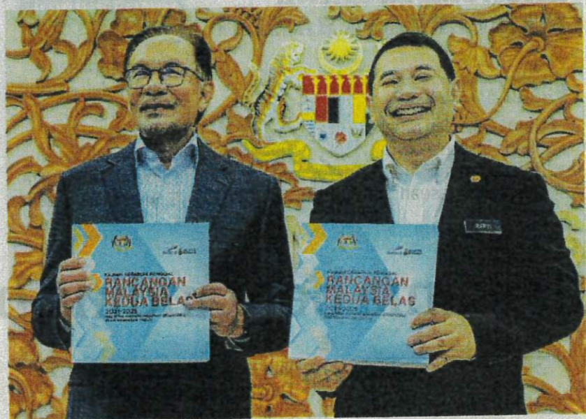
ANWAR Ibrahim (kiri) bersama Menteri Ekonomi, Rafizi Ramli menunjukkan buku Kajian Separuh Penggal Rancangan Malaysia Ke-12 (RMK12) di Bangunan Parlimen, semalam.

Mengenai subsidi, Perdana Menteri berkata, subsidi dan bantuan secara bersasar kepada