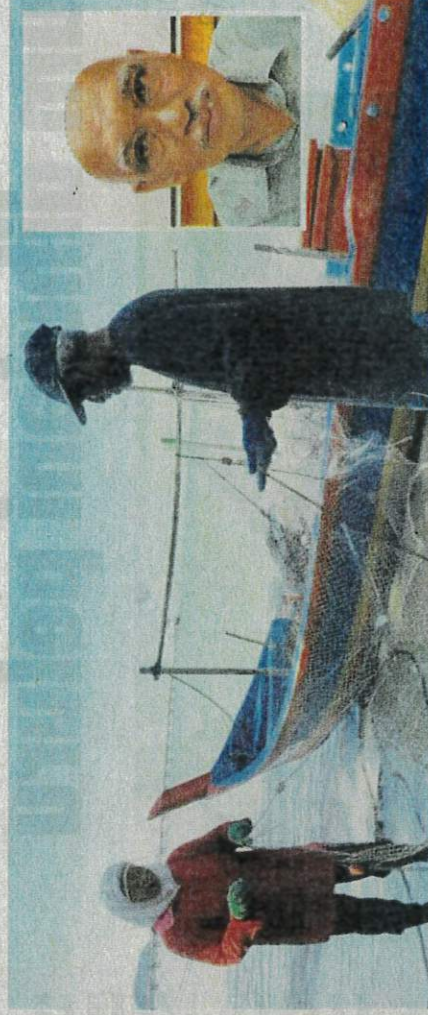
Nelayan di Pulau Pinang meminta kerajaan negeri menunggu keputusan rayuan mereka terlebih dahulu sebelum memulakan kerja awal di tapak projek.