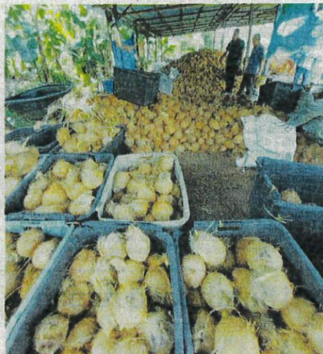
PEKEBUN di Bagan Datuk menunjukkan lambakan kelapa yang tidak terjual kesan kemasukan buah itu dari Indonesia yang lebih rendah.

Terdahulu, akhbar ini melaporkan mengenai kesukaran pekebun dan peraih di Bagan Datuk memasarkan kelapa berikutan harganya yang rendah.