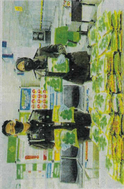
BUNGKUSAN biji benih sawi yang dirampas oleh Maqis di KLIA, Sepang Jumaat lalu.

“Hal ini boleh menyebabkan pihak kerajaan menanggung kerugian yang tinggi jika