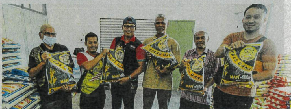
Orang ramai membeli Beras Ganu di sebuah pasar raya di Kampung Losong, Kuala Terengganu, semalam.