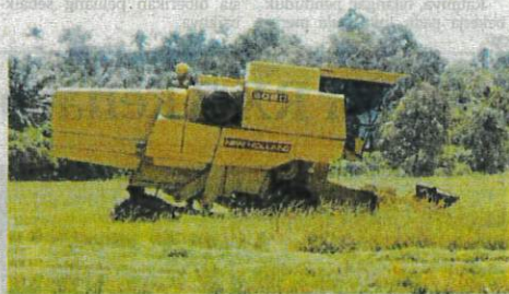
PESAWAH di Paya Sepayang dan Setajam di Rompin, Pahang memilih menjual padi kepada kilang swasta yang menawarkan harga RM1,500 satu tan metrik tan musim ini.

"Oleh itu, dengan harga tinggi ditawarkan, pesawah lebih memilih kilang swasta bagi menjual hasil padi. Tiada jualan melalui orang tengah, tetapi terus kepada pengilang swasta di