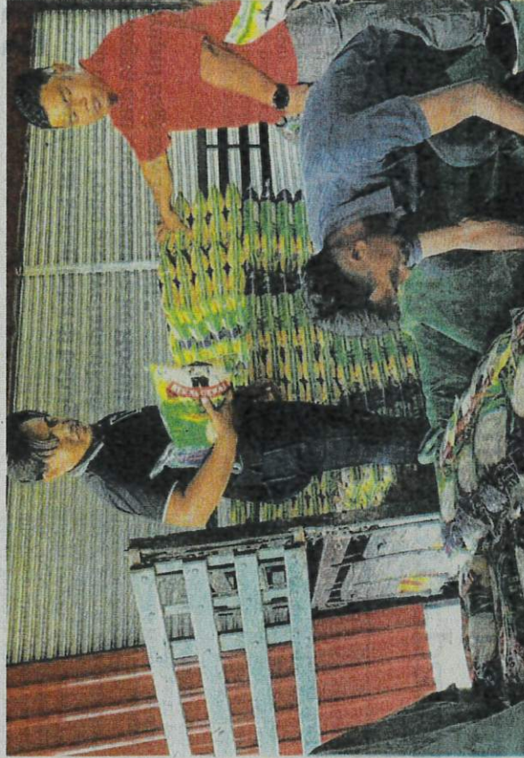
SEBAHAGIAN dari Beras Gerai yang akan diedarkan kepada PPK di seluruh Terengganu untuk memenuhi permintaan di pasaran negeri itu.

“PPK Gerai akan meningkatkan pengeluaran beras ini dua kali ganda kepada 90 metrik tan menjelang Disember tahun ini untuk terus memenuhi permintaan di pasaran Terengganu dan Selangor.