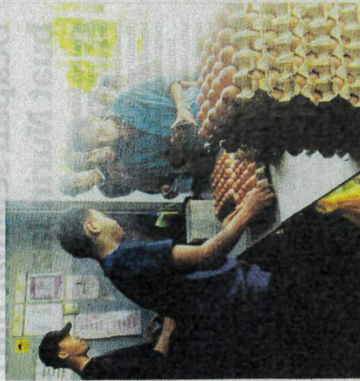
SEBAHAGIAN pengguna beratur panjang untuk membeli telur ayam di premis pemborong di Kuala Terengganu semalam.

bekalan ini disebabkan generasi ayam penelur baharu dimasukkan ke dalam reban.