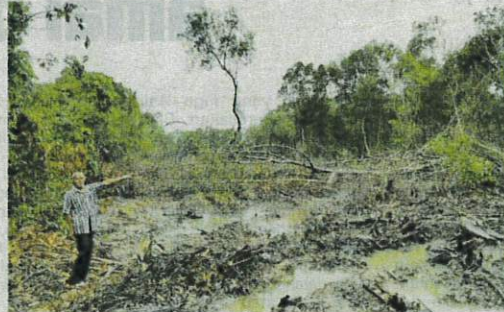
Seorang penduduk menunjukkan lokasi kawasan rancangan projek perumahan untuk nelayan Kampung Kuala Juru.

Susulan itu, Persatuan Pengguna Pulau Pinang (CAP) menggesa LKIM melaksanakan segera projek perumahan