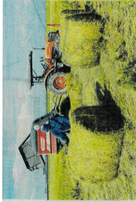
PENGELUARAN padi di Selangor pada tahun ini hanya merekodkan tiga hingga empat tan metrik sehektar.