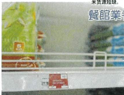
■加马超市的白米陈列架上，贴上货源短缺的小告示。

槟城一间餐馆虽没面对本地白米货源短缺问题，但供应商的白米价格一涨再涨，短短一周再涨4令吉。不愿具名的餐馆业者受访时说，供应商告知，提供给该餐馆的白米，一半是本地白米，一半是进口白米。早前每包10公斤装的成本价，是23令吉。“之后白米价格调涨至每包10公斤装30令吉维持了约2个月，上周起涨价至35令吉，没想到本周又再涨价，周五(15日)刚补货，价格是39令吉。”“我们目前没面对白米短缺问题，一切如常，只是价格涨不停。”