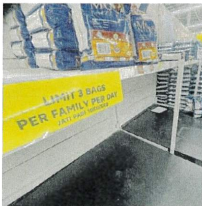
■霸市的陈列架上张贴小告示，每户家庭限制每日仅能购买3包Jati本地白米。

公司的白米库存足够应付国内5个月的需求。“我国成年人每年平均吃大约80公斤白米，而国家稻米公司的白米库存维持在约25万吨，至于市场上销售的白米则维持在大约100万吨。”“整个白米的库存量能够应付5个月的白米需求。”