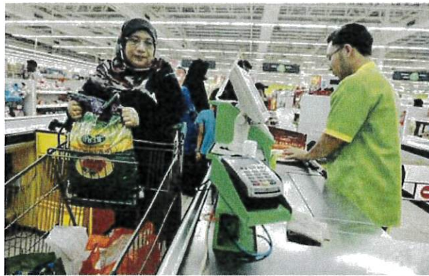
PERMINTAAN beras tempatan ataupun SST mendapat sambutan sejak kenaikan beras dunia.

boleh membantu kami untuk mendapatkan maklumat mengenai bekalan beras di seluruh negara. Dengan itu penguatkuasaan ini, kita dapat data yang lebih tepat. Setakat ini terdapat 1,200 pemeriksaan Op Jamin kita jalankan di seluruh negara dan kita dapati satu kes di Selangor yang menaikkan harga beras tempatan daripada RM2.60 kepada satu harga yang lebih dan kita sudah dakwa perucit berkenaan.