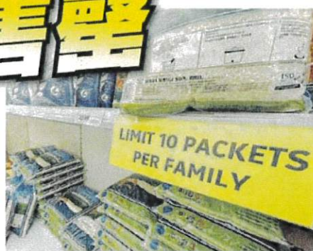
■超市贴出告示提醒消费者,每户家庭只允许购买10包本地白米。

“本地白米是补贴产品,主要让人民可购买便宜的本地白米,尤其是低收入、B40群体,但如今不少人买不到(本地白米)了。”