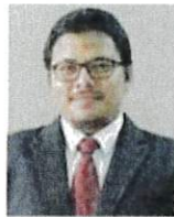
Profesor Madya di Institut Sains Biologi, Fakulti Sains, Universiti Malaya