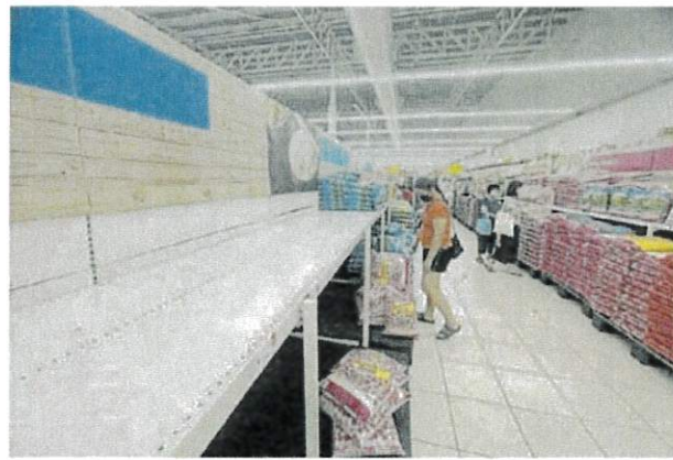
■发现置放本地白米的陈列架上，空空如也，与置放进口白米的陈列架，形成强烈对比。