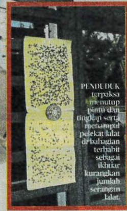
NUR Syamillah menunjukkan pelek lalat yang digunakan untuk menangani gangguan serangga berkenaan yang berpunca daripada pengurusan sisa najis reban ayam berhampiran.

buka kepada sistem reban tertutup secara berperingkat menjelang Disember 2025.