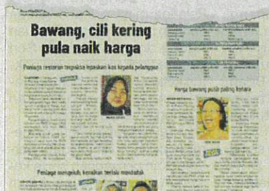
Keratan akhbar Sinar Ahad .

"Selain itu, kita juga perlu kurangkan makan makanan yang sedia masak. Kalau boleh beli bahan mentah dan masak sendiri kerana boleh pilih beras yang murah," jelasnya.