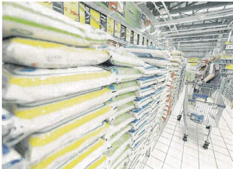
农业部已同意向小规模贸易商发放 103 个批发牌照。(档案照)

他也指出, 至于印度香米 (Basmati) 的价格, 则继续受市场价格浮动决定。