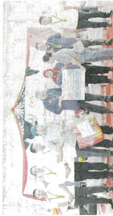
AHMAD ZAHID (lima dari kiri) sampaikan bantuan Baik Pulih Rumah kepada penerima di Sebangan, Kota Samarahan semalam.

KOTA SAMARAHAN - Seluas kira-kira 50,000 hektar kawasan di Sarawak bakal dibangunkan untuk tanaman padi, bagi meningkatkan lagi pengeluaran padi dalam negara.