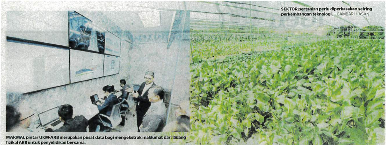
SEKTOR pertanian perlu diperkasakan seiring perkembangan teknologi. GAMBAR HIASAN