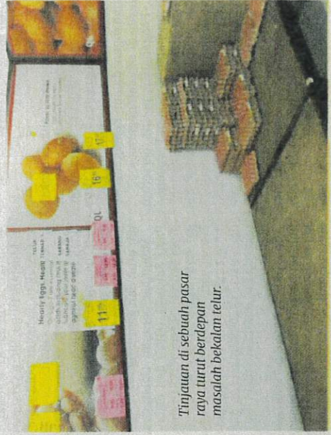
Tinjauan di sebuah pasar raya turut berdepan masalah bekalan telur.