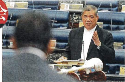
末沙布：食肆业者可享有固定进口白米价格，即每 50 公斤 160 令吉。

“通过批准证，食肆业者可享有固定进口白米价格，即每 50 公斤 160 令吉。”#