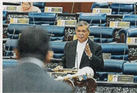
莫哈末沙布强调，经调查，没有证据显示有本地白米充装进口白米高价出售的情况。

（吉隆坡18日讯）农业及粮食安全部长莫哈末沙布说，农业及粮食安全部目前没商讨和决定是否禁止外籍人士购买本地白米。他今日在国会特别会议就第12大马计划中期检讨进行部门总结时说，外籍人士也要吃饭。