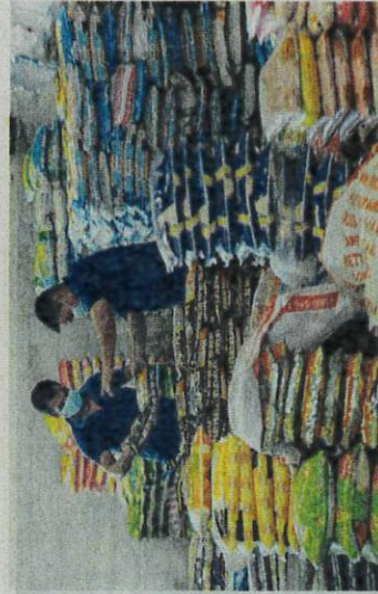
Stok bekalan beras negara kini adalah sebanyak 900,000 tan metrik.

"Sehubungan itu kementerian berpandangan bahawa masih belum terdapat keperluan mendesak yang bersifat kece-