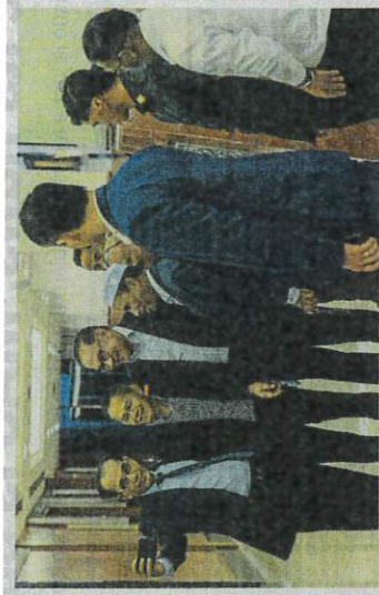
Breakaway moment Prime Minister Datuk Seri Anwar Ibrahim (third from left) sharing a light moment with guests at the Parliament's 12th Malaysia Plan mid-term review at the Dewan Rakyat in Kuala Lumpur.