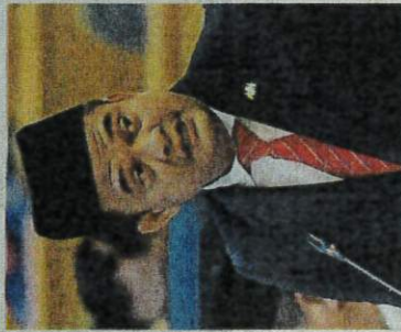
Bangunan Sultan Ismail in Iskandar Puteri.

"We wish to encourage young farmers or entrepreneurs to remain competitive so various incentives have been provided to help boost the development of the agricultural industry in Johor," he said during the Johor state assembly sitting at