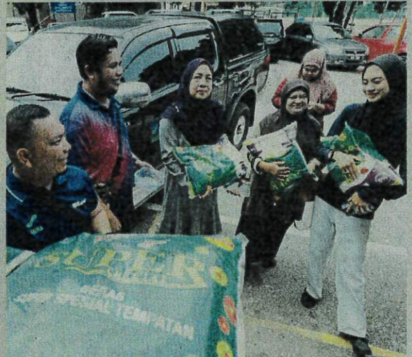
ANTARA pengguna yang tidak melepaskan peluang membeli beras putih tempatan (BPT) yang dijual di Pusat Operasi Fama Kuantan.

"Fama Pahang terus berusaha menyediakan bekalan BPT" Saiful Sadri