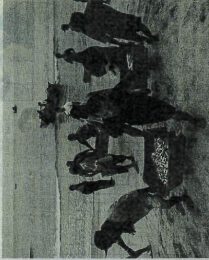
KADAR nisbah sara diri (SSR) bagi ikan sebanyak 9.7 peratus adalah situasi yang amat menyedihkan memandangkan Malaysia sebagai sebuah negara maritim tidak patut mengimport ikan sebanyak banyak bagi memenuhi keperluan negara.