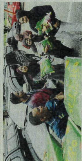
Pengguna membeli beras tempatan yang dijual di Pusat Operasi FAMA Kuantan, semalam.

Katanya, selepas pembelian beras tempatan terputus di pasaran, dia terpaksa membeli beras import kerana ia adalah beras tempatan yang lebih berkualiti dan lebih murah berbanding beras import yang lebih mahal.