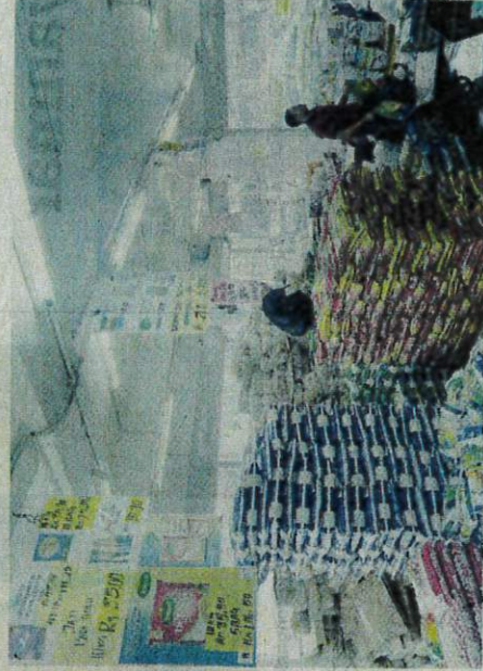
PEKERJA kedai borong menyusun kampil beras import di Jalan Chow Kit, Kuala Lumpur baru-baru ini. – GAMBAR HIASAN

"Kita masih lagi menunggu tarikh yang diberikan, jika mereka bersetuju untuk mengadakan