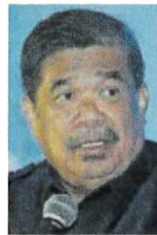
■ 將與印度磋商白米進口事項。 莫哈末沙布：我國