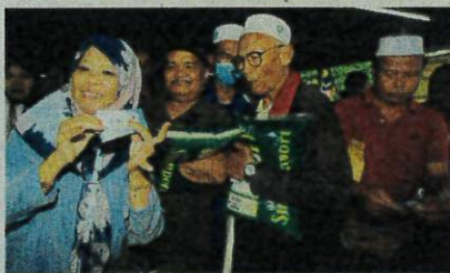
ORANG ramai datang seawal 6 pagi untuk membeli beras putih import berjenama SIT1 dengan hanya RMI pada Program Misi Jual Beras RMI di Padang Kampung Dato' Seri Kamaruddin Manjung, Lumut, kelmarin. Program anjuran pertubuhan bukan kerajaan (NGO) Founder Misi Rakyat menyediakan sebanyak 1,000 kampakit beras lima kilogram itu habis terjual dengan hanya mengambil masa kira-kira setengah jam sahaja.

"Bekalan beras putih kita masih mencukupi, cuma kalau harga beras yang diimport itu tinggi, menyebabkan orang mencari beras tempatan secara mendadak dan berlakunya sedikit kekurangan di beberapa tempat. Tetapi, kita atasi masalah itu, sekarang ini kita lakukan tuai di Mada (Lembaga Kemajuan Pertanian Muda), saya tidak ingat berapa jumlah kampakit beras yang akan dikeluarkan, tetapi dalam masa tidak sampai sebulan ini, ia akan berada di pasaran dan sekarang pun kita ada cuba untuk top-up mana-mana yang berlaku kekurangan. Selain India, kita boleh dapatkan bekalan beras putih ini dari Pakistan, Vietnam atau Thailand, tetapi semua pun mengalami kenaikan harga dan lebih parah sekarang ini isu kekurangan beras menjadi masalah dunia dan kita ini terjejas, tetapi tidak seteruk berbanding negara lain," katanya.