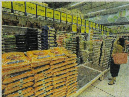
WALAU PUN pelbagai usaha dilakukan tetapi isu kekurangan beras putih tempatan masih gagal diatasi sepenuhnya oleh kerajaan.

"Kerajaan harus fokus kepada perubahan sistemik seperti meningkatkan produktiviti, bekalan padi dan beras agar rakyat sentiasa cukup untuk berhadapan dengan ketidaktentuan cuaca yang boleh mempengaruhi penghasilan beras," katanya ketika dihubungi.