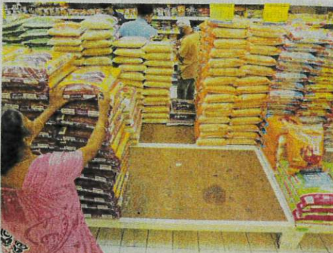
Keperluan beras negara ialah 2.5 juta tan setahun menurut data BERNAS. (Foto hiasan)

"Bagi sekampit beras tempatan dengan berat 10 kilogram (kg) yang dijual pada harga RM26, mereka hanya memperoleh keuntungan sekitar 50 sen," katanya.