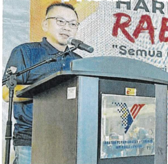
■陈泓縑（左）在大会上发表演说。

（吉隆坡1日讯）农业及食品全部副部长陈泓縑指出，随着本周本地白米供应恢复稳定，相信抢购白米风潮的情况将会消失。