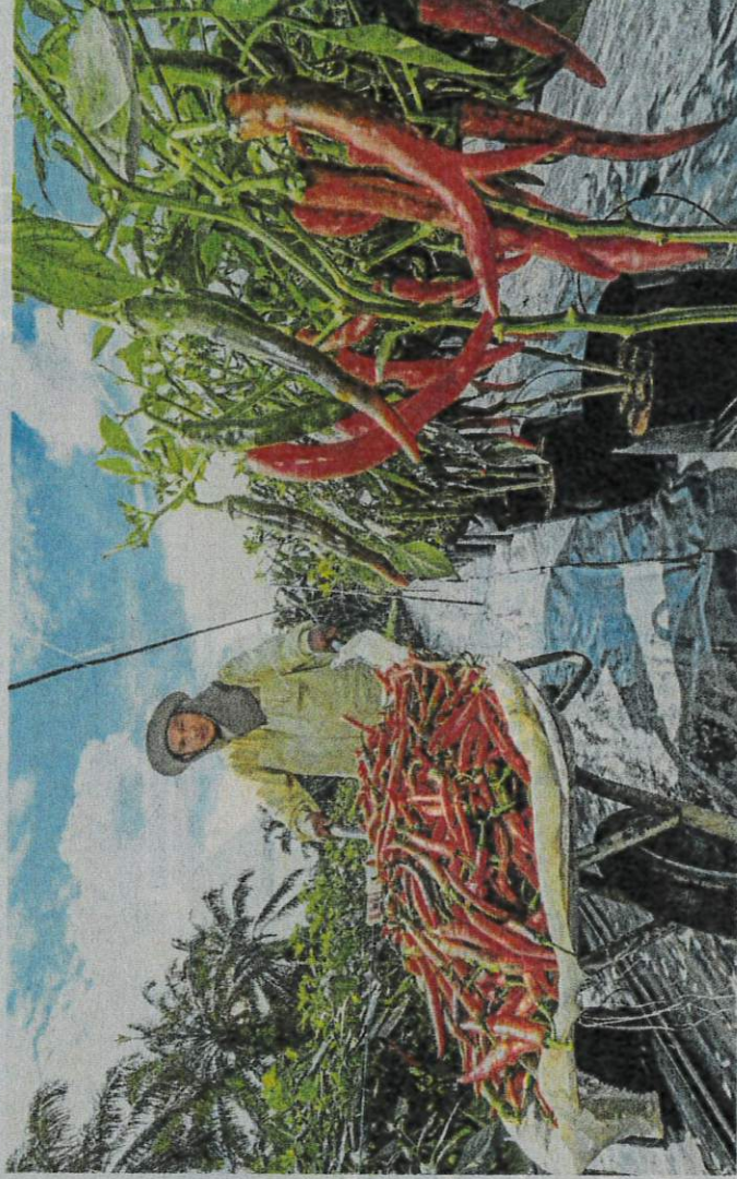
Pelaksanaan projek IPR-INTAN menambah pendapatan rakyat serta meningkatkan kemampuan bekalan makanan. (Foto hiasan)

Projek pertanian yang boleh diusahakan adalah tanaman