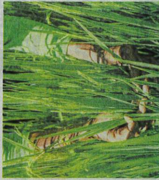
KERAJAAN Negeri Sembilan akan mewujudkan kawasan pembenihan padi bagi meningkatkan kualiti hasil padi.