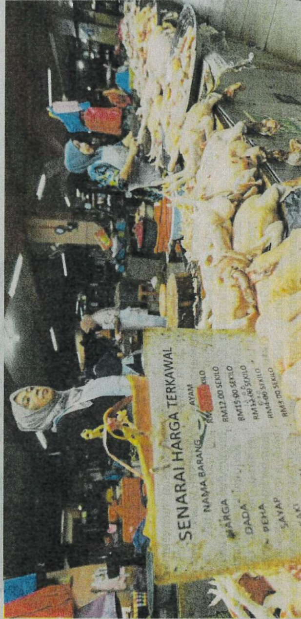
Zarina mendakwa permintaan tinggi punca kenaikan harga ayam ketika ditemui di Pasar Besar Siti Khadijah, Kota Bharu.

"Jika perkara ini tidak dipantau, ia bukan sahaja membeban-