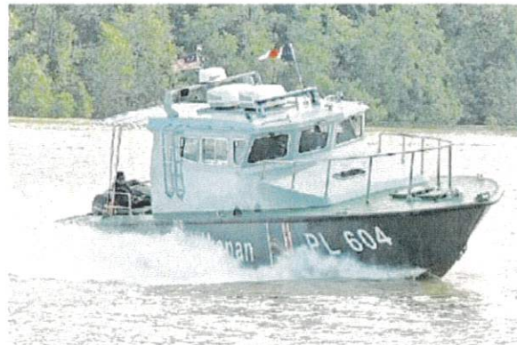
The new patrol boat is powered by two four-stroke engines with 350 horsepower, and equipped with electronic navigation equipment such as GPS, radar, echo-sounder and communication devices.

In this regard, he said the additional high-powered patrol boats needed to be procured to enhance the security of the state's waters and two new high-speed patrol boats, should be delivered by 2025.