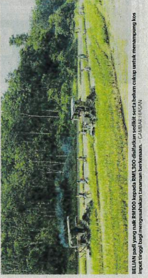
BELIAN padi yang naik RM100 kepada RM1,500 diifikan sedikit sert belian cukup untuk menampung kos input tinggi bagi mengusahakan tanaman berkesan. - GAMBAR HIASAN

"Kami berharap kerajaan dapat melaksanakan subsidi tenaga buruh dan tenaga buruh yang munasabah," katanya.