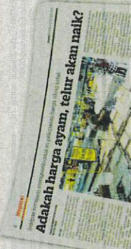
Adakah harga ayam, telur akan naik? (Will chicken prices, eggs rise?)

Langkah ini penting supaya tidak terganggu dengan kenaikan ternanya membolehkan pasaran tempatan dapat berfungsi se-