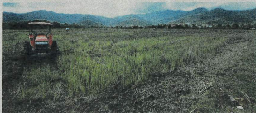
FELCRA diamanahkan untuk bangun estet padi berskala besar di Sabah dan Sarawak.

keluasan kawasan berpotensi yang sesuai untuk pembangunan estet padi adalah seluas 4,839 hektar.