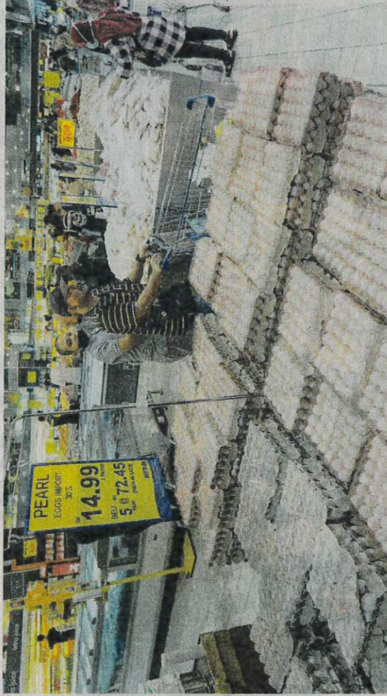
PEMBELI membeli telur ayam dan ayam di sebuah pasar raya. Harga telur dan ayam dijangka meningkat selepas kerajaan memutuskan untuk mengupungkannya kembali. - GAMBAR HIASAN

lumi ini akan 'dilepaskan' supaya pasaran tempatan boleh berfungsi dengan bebas dalam memastikan keterjaminan bekalan tersebut di pasaran.