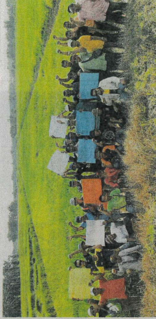
PESAWAH berhimpun menuntut harga belian padi yang lebih tinggi di Sungai Manik, Pasir Salak, Perak.

umumkan iaitu naik daripada RM1,200 kepada RM1,300 memang tidak cukup buat kami sebab kos sawah sudah meningkat.