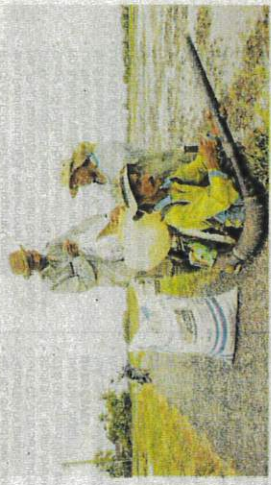
PESAWAH memasukkan benih padi ke dalam mesin penabur padi. - GAMBAR HIASAN

"Saya dimaklumkan ada petani yang duduk di Kota Kuala Muda terpaksa mencari cari benih di sebelah Kedah utara. Itu pun mereka terpaksa beli dengan harga mahal," katanya.