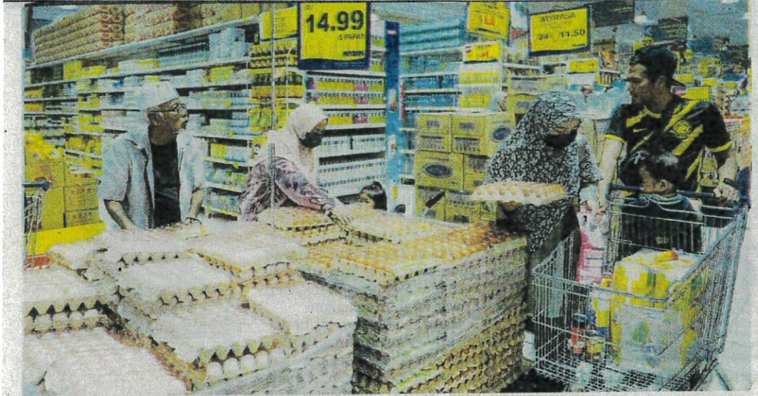
SUBSIDI harga telur yang diberikan kerajaan sebelum ini bukan sahaja memberi manfaat kepada rakyat bawahan, tetapi turut dinikmati oleh warga asing dan golongan kaya di negara ini. – GAMBAR HIASAN

Apung harga untuk salur peruntukan golongan sasar