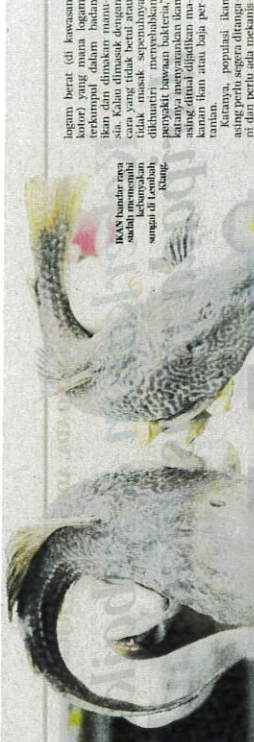
IKAN bunder rupa... sangat memikat... sungguh di Lantau... Klang.

"Terdapat kawasan dan usaha membina... sangat penting untuk... mendukung... kelestarian... sumber air... yang... mendukung... kelestarian... sumber air..."