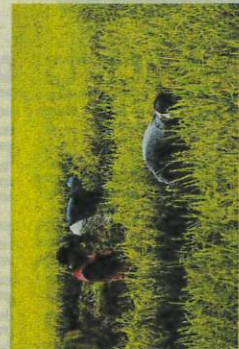
Pesawah bertempas pulas di tengah bendang demi rakyat Malaysia.