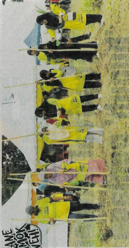
Sebahagian peserta menghadiri Majlis Perasmian Komit dan Pelancaran Tanaman Padi Darat Sara Diri Bersama Yayasan Amal Malaysia di Marang, Terengganu.

Sementara itu, beliau berkata, langkah Komit perlu menjadi contoh kepada kariah masjid yang lain untuk menubuhkan koperasi komuniti berasaskan pertanian.