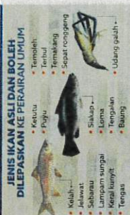
JENIS IKAN ASLI DAN BOLEH DILEPAHKAN KE PERAIRAN UMUM. Templeh, Terulu, Tembakang, Sepat, Keli, Kakap, Bawal, Sotong, Udang galah, Ikan mas, Ikan kembung, Ikan banggai merah, Ikan banggai putih, Ikan banggai hitam, Ikan banggai kuning, Ikan banggai merah, Ikan banggai putih, Ikan banggai hitam, Ikan banggai kuning, Ikan banggai merah...