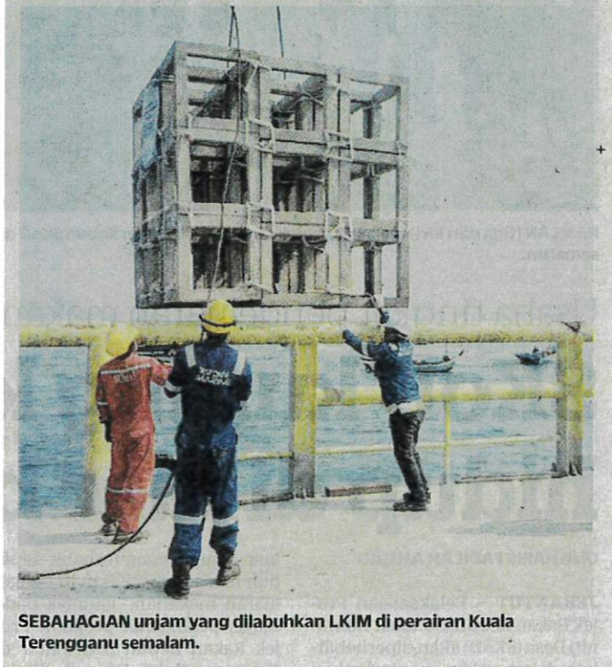
SEBAHAGIAN unjam yang dilabuhkan LKIM di perairan Kuala Terengganu semalam.