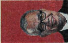
DR AHMAD IBRAHIM

fair market prices for their products, they may reduce their output or shift to more profitable crops.