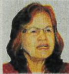
Felo Perunding dan Pemegang Kursi Keterjaminan Makanan, Institut Pertanian Tropika dan Sekuriti Makanan, Universiti Putra Malaysia (UPM)

● Selama ini, kos pengeluaran padi di negara ini ditanggung sebahagian besar oleh kerajaan melalui subsidi serta perbelanjaan prasarana