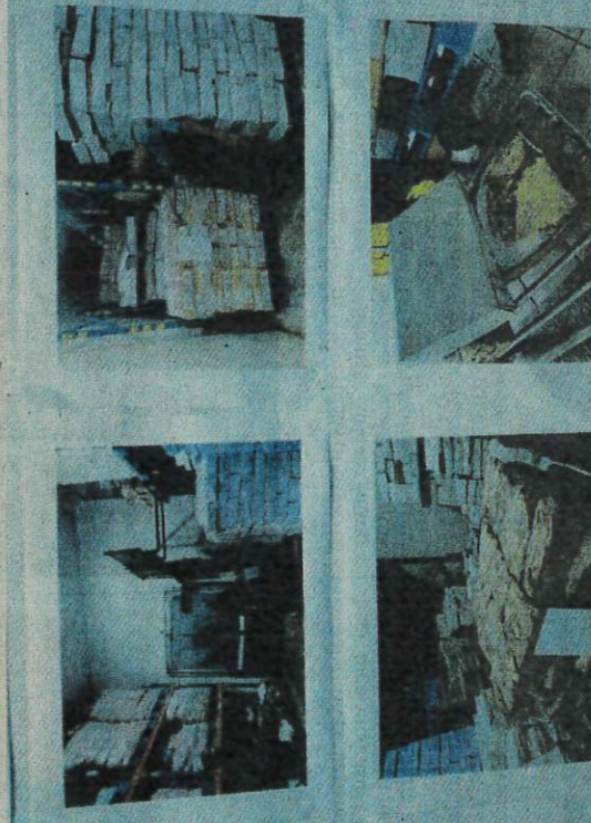
POLIS menjatuhkan serbuan selepas kedua-dua premis disyaki memiliki produk dan hasil haiwan tanpa lesen yang sah di sekitar Penampang pada Sabtu lalu.

Katanya, semua rampasan diserahkan kepada Pegawai Operasi Seksyen Vegetarian Sabah untuk siasatan lanjut mengikut Seksyen 15(1) Enakmen Haiwan 2015 Negeri Sabah.