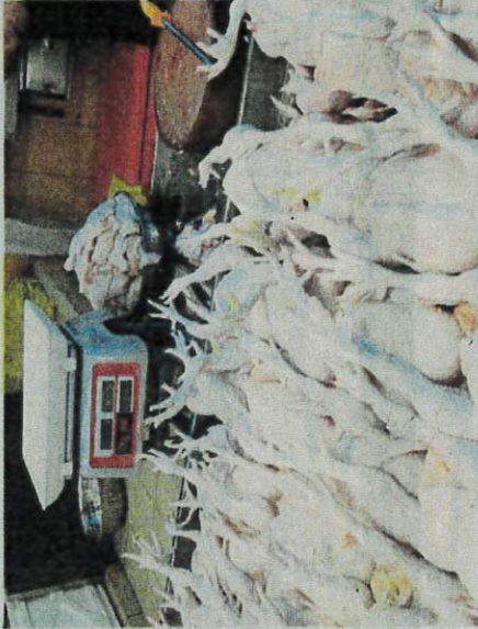
The announcement in the 2024 Budget to phase out the price control of eggs and chicken will boost production. FILE PIC

These structural issues need to be addressed separately to improve food security.