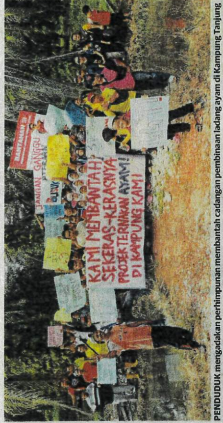
PENDUDUK mengadakan perhimpunan membantah cadangan pembinaan ladang ayam di Kampung Tanjung Sari di Pasir Salak.

"Jika bau busuk dan banyak lalat, bagaimana kami hendak