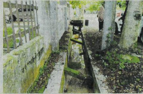
Keadaan longkang di taman perumahan berkenaan yang dipenuhi pasir akibat banjir kilat yang berlaku setiap kali hujan lebat.

Katanya, setiap kali hujan air akan naik di hadapan rumah dan selapas surut, sisa pasir serta lumpur ditinggalkan di atas jalan berhampiran rumah.