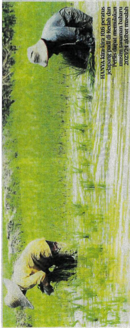
HANYA kira-kira 106 peratus jelapang padi di Kedah dan Perlis dapat memulakan musim tanaman baharu 2023/24 akibat masalah ketiadaan bekalan BPS.