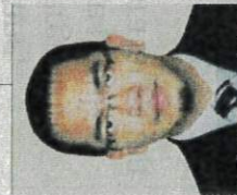
Pensyarah Kanan Jabatan Perdagangan dan Ekonomi Biosumber, Fakulti Pertanian, Universiti Putra Malaysia (UPM)