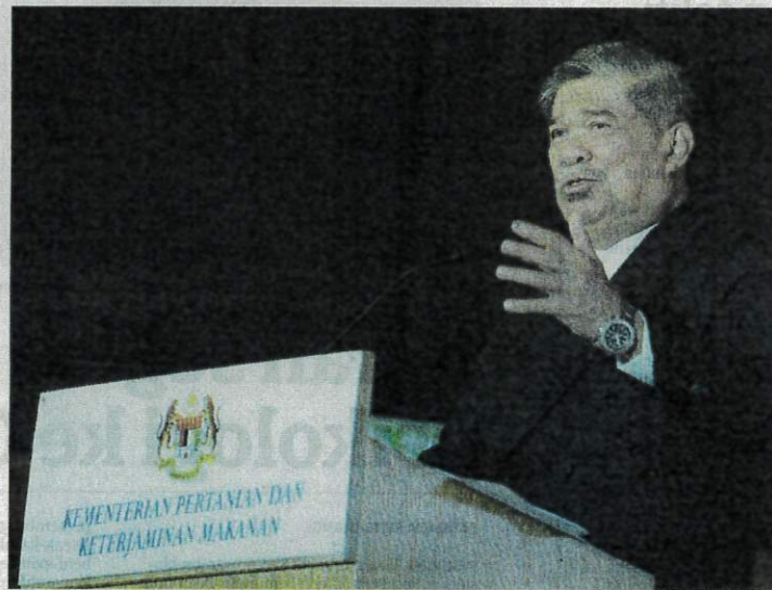
PENULIS menaruh harapan tinggi kepada Mohamad Sabu agar mengupayakan setiap jabatan dan agensi di bawah kementerannya dengan penyampaian perkhidmatan bermutu.

Pertama, pelaksanaan penilaian sendiri secara jujur perkhidmatan dan produktiviti jentera KPKM. Mulakan dengan bedah siasat ucapan bekas menterinya, Allahyarham Datuk Seri Salahuddin Ayub pada 6 Januari 2020 kepada warga kementerannya. Tidak pernah seorang menteri lantang secara terbuka melahirkan kekecewaan dengan prestasi kementerian diterajunya. Jelas beliau meluahkan isi hati cara kementerannya berfungsi dalam meningkatkan kualiti perkhidmatan