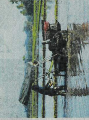
SEORANG pesawah membuat peredaran untuk memulakan musim baharu tanaman padi walaupun berdepani isu bekalan dan harga benih.

Untuk itu, kerajaan, tindakan pengatkuasaan dilaksanakan bagi menyenak kesurua 439 peruncit benih padi di seluruh negara bagi memastikan tidak ada mana-mana pihak melanggar