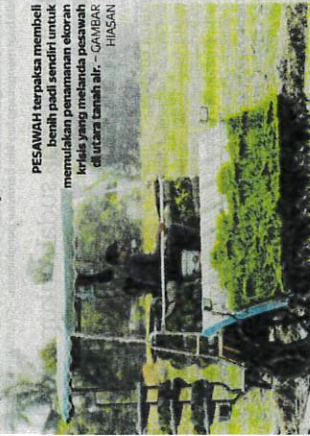
Hanya 10.6 peratus kawasan MADA dapat tuam padi

PESAWAH terpaksa membeli benih padi sendiri untuk memulakan penanaman ekoran krisis yang melanda pesawah di utara tanah air. - GAMBAR HIASAN