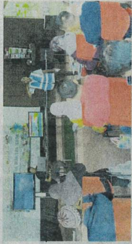
Sebahagian kursus yang dijalankan di Kompleks Desa Warisan iGrow di Mukim Pulau Tiga, Kaungung Gajah.

baharu di Kampar yang berciri futuristik, terutama dari segi kemudahan dan capaian teknologi bagi rancangan membangunkan lagi sektor pertanian lebih moden.