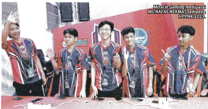
Miracle Gaming menjuarai ML NAFAS-NEKMAT sempena HPPNK 2023.