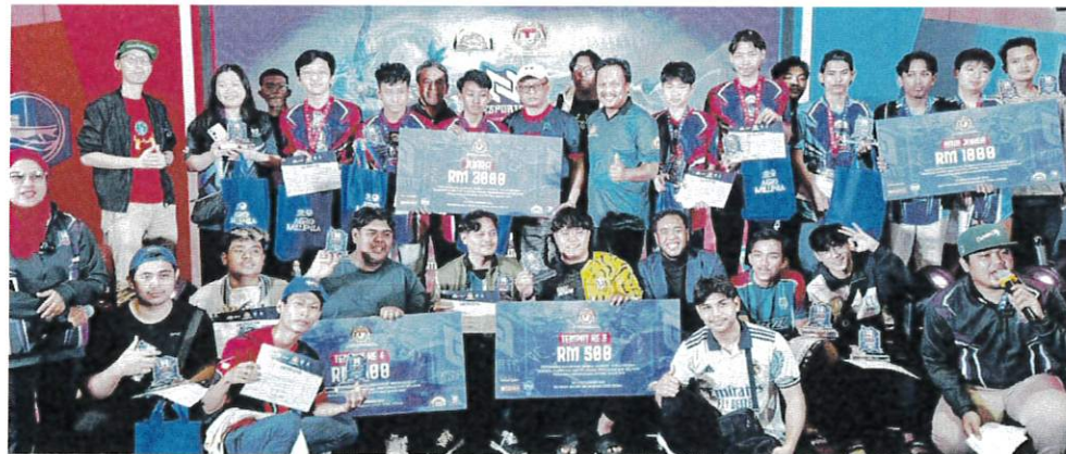
Pemenang pertandingan e-Sukan, Mobile Legend NAFAS-NEKMAT bersama hadiah dan trofi masing-masing.

NEKMAT pula mengadakan promosi dan jualan hasil perikanan jenama ENNA di segmen Agro Madani dengan potongan harga dan kombo jualan istimewa untuk pengunjung.