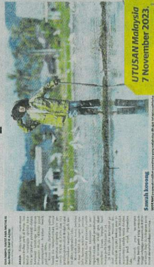
Saravali, Kertang UTUSAN Malaysia 7 November 2023.