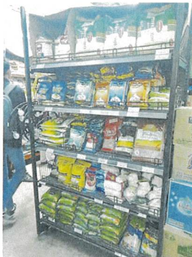
国家糯米公司在 9 月调高进口白米售价。

“纵观过去控制售价的商品，我们不难发现这些商品最终皆面对运作扭曲现象，为此，恕我直言，只有让国内白米价格全面自由浮动，才能全面解决本地白米遭掺入进口白米包装出售的问题，同时一劳永逸改善该产品供应短缺的现象。”