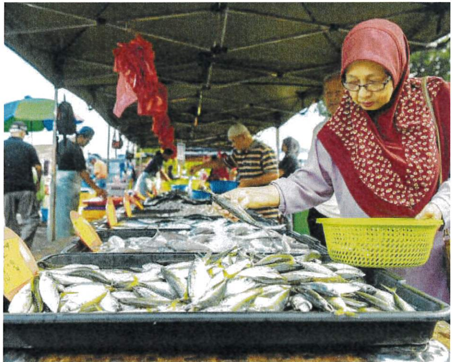
The department said the kembung species, which is the main fish consumed by Malaysians, is readily available in the country.