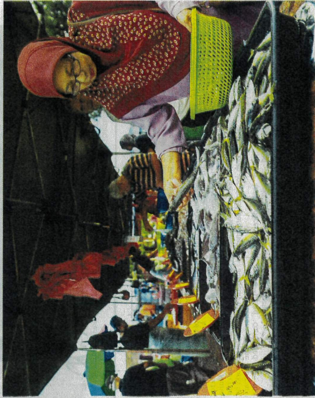
The department said the kembung species, which is the main fish consumed by Malaysians, is readily available in the country.