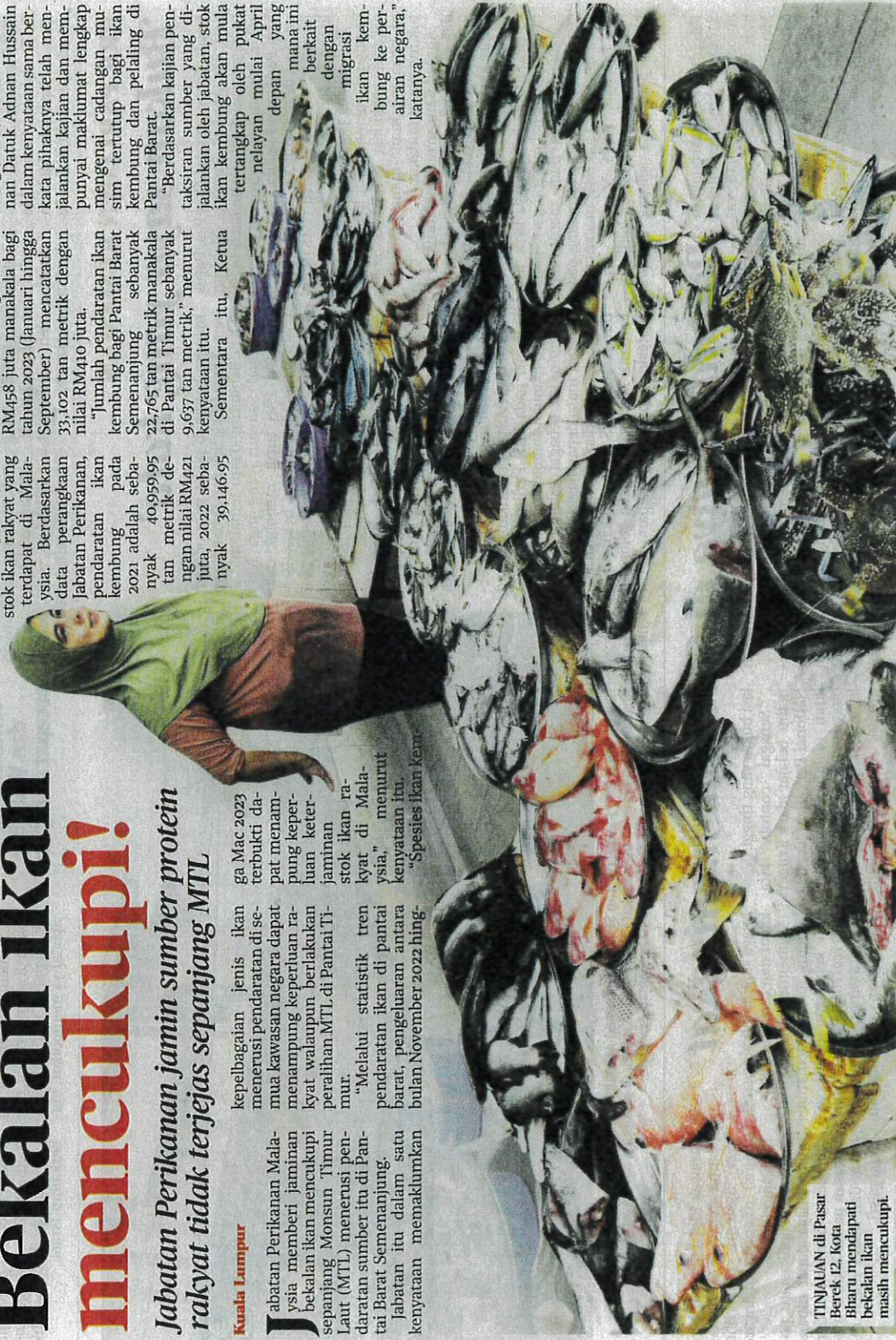
TINJAUAN di Pasar Berek 12, Kota Bharu mendapati bekalan ikan masih mencukupi.

"Berdasarkan kajian pendaratan sumber yang dijalankan oleh jabatan, stok ikan kembung akan mula nelayan mulai April depan yang mana ini berkait dengan migrasi ikan kembung ke perairan negara," katanya.