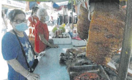
■一旦豬肉價出現波動，預計燒豬、燒肉等價格會受影響。

所謂屠商是宰豬場和豬肉販之間的“中間人”，類似提豬商，主要是在宰豬場提豬後載往宰豬場宰殺，之後再