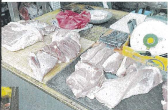
←雪隆一帶的豬肉價在近一兩年來已多次調價。