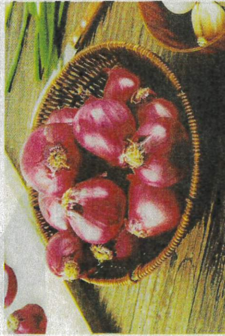
BAWANG merah hasil kajian Mardi berwarna terang, lebih segar, tahan serangan penyakit dan serangga.

PETALING JAYA – Hasil kajian Institut Penyelidikan dan Kemajuan Pertanian Malaysia (Mardi) berkaitan bawang sejak tahun 2020 telah membolehkan agensi tersebut melancarkan tiga varieti bawang merah iaitu BAW-1, BAW-2 dan BAW-3 di Show Tech Mardi 2023 pada bulan Ogos lalu.