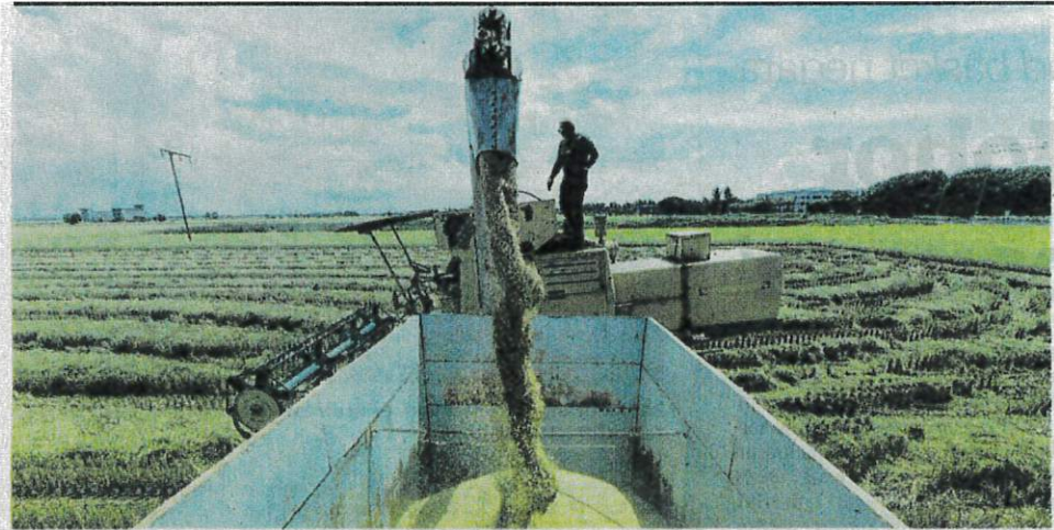
BENIH padi jenis MR297 akan dibekalkan kepada pesawah di Melaka dalam usaha meningkatkan hasil pengeluaran tanaman tersebut. - GAMBAR HIASAN

Inisiatif bantu pesawah tingkat pengeluaran hasil