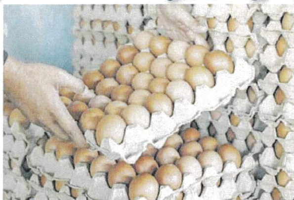
■ 阿米尔建议，让鸡蛋价格浮动，解决鸡蛋短缺。

可以让养鸡业者喘口气，以及有能力产出更多鸡蛋；届时，政府就不必再继续为他们提供补贴。