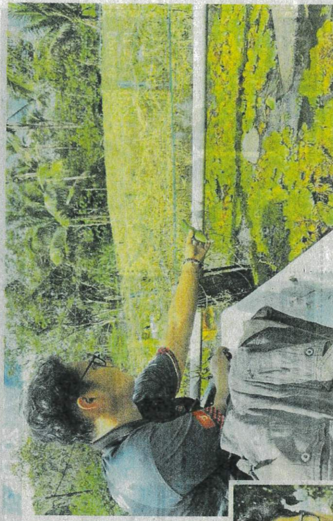
Sayur timun yang tidak sempat dikutip kerana banjir.

“Air naik mendadak kerana hujan semalam (Rabu) dan menenggelamkan timun-timun hingga rosak serta tidak dapat diselamatkan,” katanya ketika ditemui di