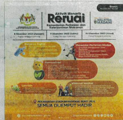
Terdapat pelbagai aktiviti bermanfaat di reruai KPKM.