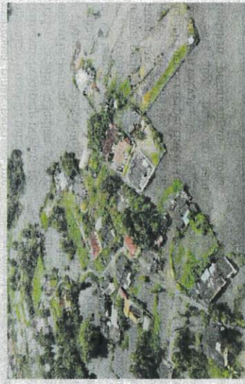
KEADAAAN banjir yang melanda Kampung Gong Baru, Kuala Terengganu, baru-baru ini.

"Kebiasaannya bantuan bagi kemusnahan tanaman padi akibat bencana banjir ini disalurkan oleh kerajaan Pusat di bawah Tabung Bencana Tanaman Padi," ujarnya.