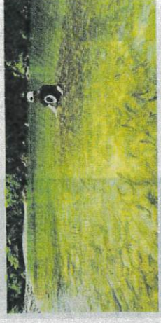
Sistem tagal merupakan satu kaedah pemuliharaan ekosistem sungai yang diterima komuniti setempat dan berfaedah dilaksanakan di Sabah.

"Pembangunan modul ini saya lakukan kerjasama dengan Sekolah Kebangsaan Maratou di Ranau bagi membolehkan komuniti dan berfaedah kepada komuniti dengan membuat pingat emas."