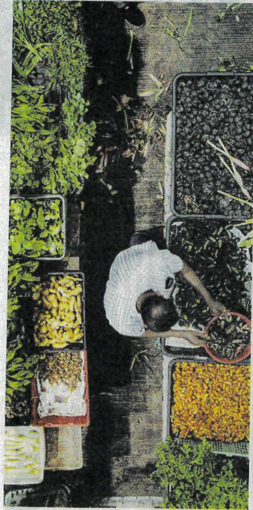
HARCA sayur-sayuran dijangka naik sehingga 40 peratus sehingga akhir tahun ini akibat musim tengkujuh. - GAMBAR HIASAN

"Kami yang menerima sayur-sayuran tersebut daripada pembekal tiada pilihan selain