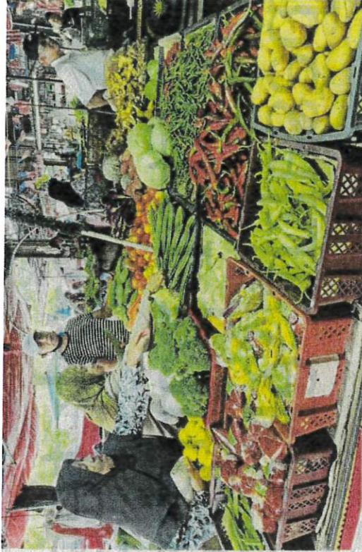
Tinjauan harga sayur di Pasar Cabang Tiga, Kuala Terengganu, semalam.

"Apabila berlaku kenaikan seperti ini, saya terpaksa menghadkan pembelian yang banyak dari-