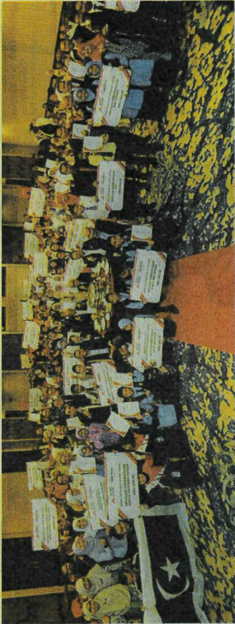
PARA pemenang Program Rakan Tani Muda Agrobank 2023 bergambar kenangan selepas majlis penyampaian hadiah di Hotel Bangi Resort.

"Kami komited ingin menerapkan nilai-nilai pertanian di peringkat lebih awal serta bagi merealisasikan matlamat SDGs untuk melindungi, memulihara dan menggalakkan pengguna-