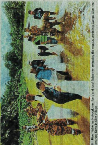
Slim River Fisheries Network members and local fishermen releasing the mytilus seeds into Sungai Slim near Kampung Sawi in Slim Village.