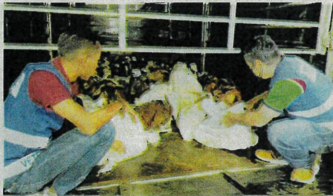
DUA kakitangan JPV Terengganu memeriksa sebahagian daripada 78 ekor kambing seludup dari negara jiran yang dirampas di Kuala Terengganu semalam.

“Kambing-kambing itu memiliki simptom-simptom penyakit TB iaitu organ dalamnya seperti buah pinggang, paru-paru dan hati telah rosak,” katanya.