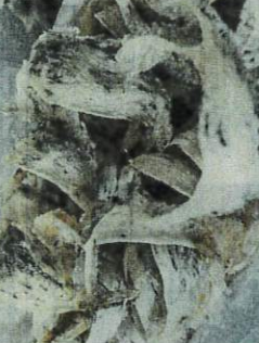
Raw and unprocessed beef heads contribute to lucrative incomes. (Left) A wall of bricks has been put up behind the windows of the shoplet believed to be used for swiflet farming.