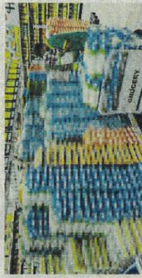
Beras tempatan menjadi rebutan disebabkan beras import mahal.

Isu bekalan beras tempatan disebabkan beras import mahal. "Fleka beras, ayam, telur, umbi masalah bawang pula. Masalah makanan ini yau mukleimah, pasti akan ada," katanya.