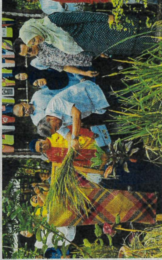
MOHAMAD melakukan simbolik menuai padi pada Majlis Tuai Padi Bersama Menteri Pertanian dan Keterjaminan Makanan dan Lawatan Kerja sempena Program Lestari Alam Sekitar di Kelab Kebun Rumah Pangsa AU2, Taman Keramat, semalam.

Dalam perkembangan berikaitan, beliau menggalakan persatuan penduduk memohon Dana Komaniti Madani berjumlah RM1 bilion yang diperuntukkan di bawah Jabatan Perdana Menteri.