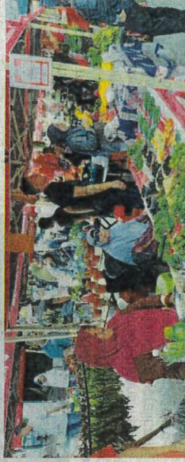
Antara peniaga yang mengambil bahagian kempen Cashless Pekan Sehari Temerloh anjuran Agrobank.

Dalam majlis sama, Wan Rosdy turut memaklumkan kerajaan negeri telah pun melaksanakan Pelan Digital Pahang 2012-2025.