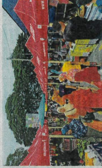
Agrobank terus melaksanakan usaha berterusan bagi memastikan para peniaga industri tani beralih ke transaksi tanpa tunai.

Selain di Pahang, ujar beliau program tanpa tunai itu telah dilaksanakan di beberapa negeri lain antaranya di Daro, Sarawak dan Pasar Malam Api-Api di Kota Kinabalu, Sabah.