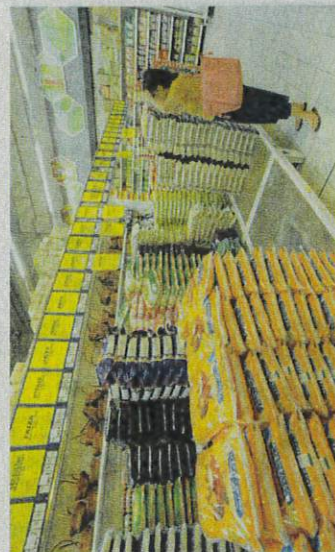
MASALAH bekalan beras tempatan masih berlaku tetapi sudah sembah berunding. - GABERAI HUSON

Berita kita hanya 65 peratus, kita tidak cukup 35 peratus maka kita akan import. Kita akan import beras tempatan. Jadi bekalan beras tempatan adalah mencukupi.