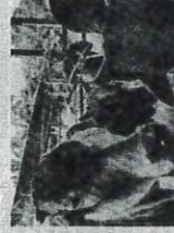
KERAJAAN seharusnya menyediakan tempat pemindahan sementara yang lebih selamat untuk haiwan ternakan sebelum muabah banjir.