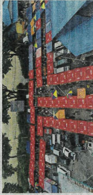
Pemandangan dari udara Pasar Sehari Temerloh.

TEMERLOH - Kerajaan negeri Pahang memuji langkah Bank Pertanian Malaysia Berhad (Agrobank) membantu para peniaga di Pasar Sehari Temerloh meningkatkan prestasi jualan mereka menerusi penggunaan perkhidmatan transaksi tanpa tunai (cashless). Menteri Besar, Datuk Datuk Seri Wan Rosdy Wan Ismail berkata, usaha Agrobank itu bukan sahaja memudahkan urusan pembayaran di antara peniaga dengan pembeli, tetapi