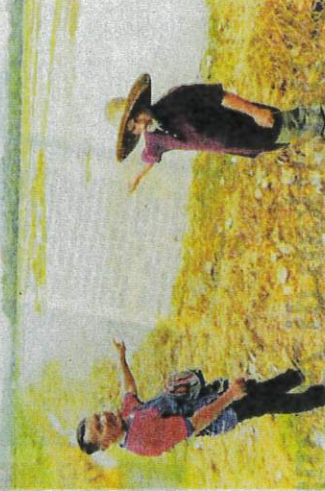
PESAWAH menunjukkan bendang mereka yang belum boleh diusahakan sepenuhnya ekoran banjir besar tahun lalu ketika ditemui di Hulu Terengganu semalam.

Tambahnya, mereka hanya mampu berserah dan berdoa agar banjir di daerah ini yang baru pulih keilmarin tidak berulang semula.