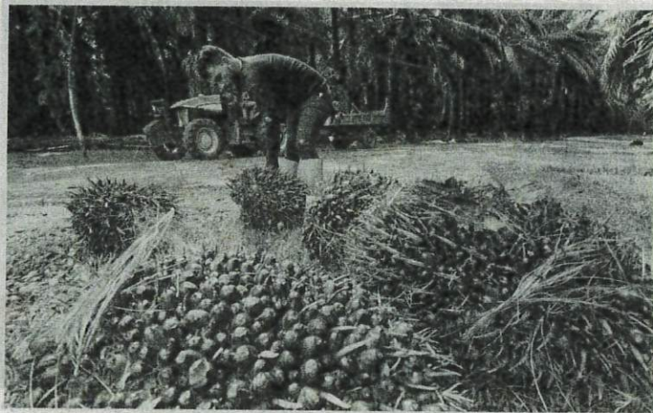
KEKURANGAN tenaga kerja dalam ladang kelapa sawit sejak tahun lalu mencecah 63.000 orang mengakibatkan sektor sawit kerugian RM20 billion.

kerajaan berkaitan, termasuk dilantik menganggotai pelbagai jawatankuasa peringkat kerajaan membolehkan saya menilai kelemahan dan memberikan syor untuk meningkatkan penyertaan tenaga mahir dalam dua sektor ini terutama dalam kalangan generasi muda.