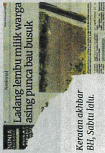
Ladang lembu milik warga asing punca bau busuk

Kuala Selangor: Pemilik sebuah ladang ternakan yang menyebabkan lebih 200 penduduk di Jalan Pak Itam, Batu 19, Jeram, di sini, resah dan tidak selesa dengan bau najis pada Jumaat lalu, diarah menghentikan aktiviti selama 14 hari.