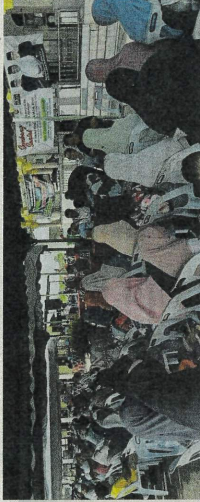
Sebahagian para petani yang hadir di Laman Masjid Kampung Hutan, Padang Hang, Anak Bukit.

Selain itu, para pesawah juga ingin penjelasan berka-