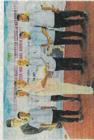
Salah seorang nelayan menerima PSN.