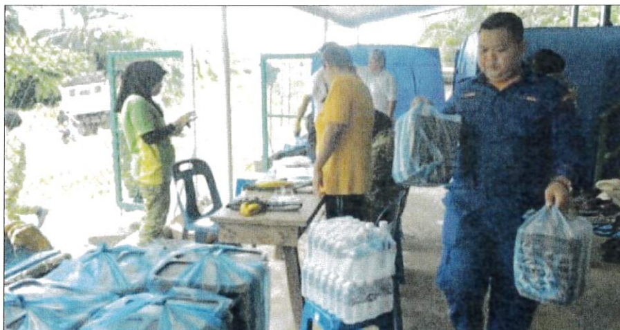
PEKARANGAN PPS Masjid Nur Iman di Sandakan.

Inisiatif dilancarkan oleh Menteri Pertanian dan Keterjaminan Makanan Datuk Seri Mohamad Sabu pada 16 April lepas itu menyasarkan 5,000 sesi jualan dengan RM39 juta nilai jualan tahun ini. – Bernama