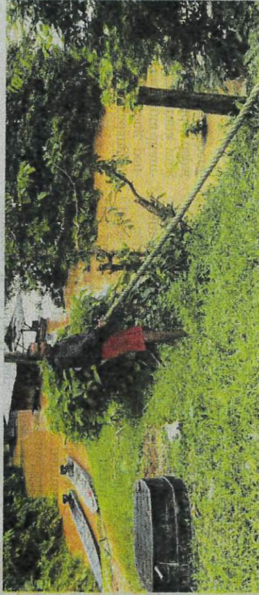
ROHAIMIN mengetatkan ikatan tali.

Katanya dia mula menternak ikan sangkar pada Januari 2021 bagi menambah pendapatan keluarga ketika negara berdepan dengan pandemik Covid-19.