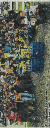
Mu dan Karipal bersempena pada 22 Disember.

PADANG BESAR, Karipal, Mini Ruminan Perlis yang berlangsung selama tiga hari bermula 22 Disember hingga 24 Disember, telah berjaya menarik lebih 10,000 pengunjung. Himpunan julung kali ini dianjurkan oleh Persekitaran Ruminan Perlis dengan kerjasama Pejabat Pengerusi Daerah Perlis dan Pejabat Pengerusi Daerah Karipal.