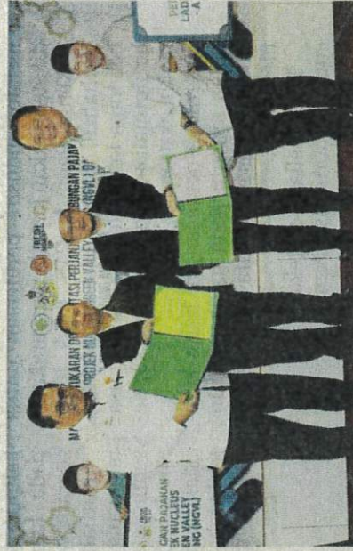
Pertukaran Dokumentasi Perjanjian Sambungan Pajakan Tanah Projek Nucleus Green Valley Lojing.

Permulaan pajakan tanah oleh FMSB pada Disember 2010 bagi tempoh 33 tahun dan sehingga 2023 yang melibatkan pelaburan sebanyak RM25 juta. Fokus tanaman ialah tomato dan lada benggala.