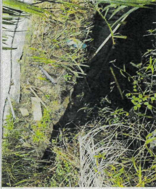
Air dalam parit berhampiran dipercayai tersumbat dan berwarna hitam berpunca daripada sisa najis lembu diusahakan warga asing berhampiran Jalan Pak Itam, Jeram, Kuala Selangor.

Tinjauan di lokasi mendapati, jarak rumah penduduk dengan