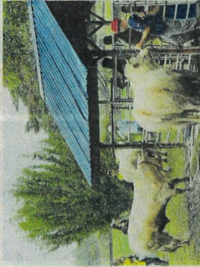
Lembu sado di Perlis.

“Di samping memberi peluang kepada pengunjung hadir melihat sendiri baka lembu ini,