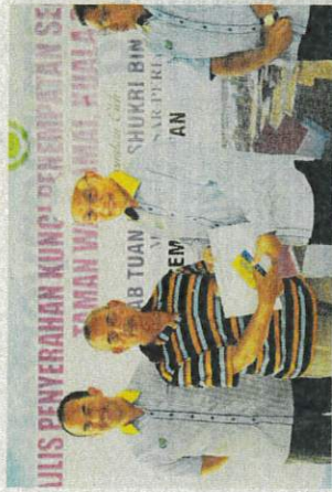
AB menyarakikan baur dari dokumen PSN.